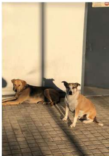
Ζωή χωρίς ρυτίδες... τίποτα δεν είδες...

-Μια παρέα κανονίζουμε να βρεθούμε, να μπορούμε μια συγκεκριμένη ώρα όλοι μαζί στο διαδίκτυο ταυτόχρονα.