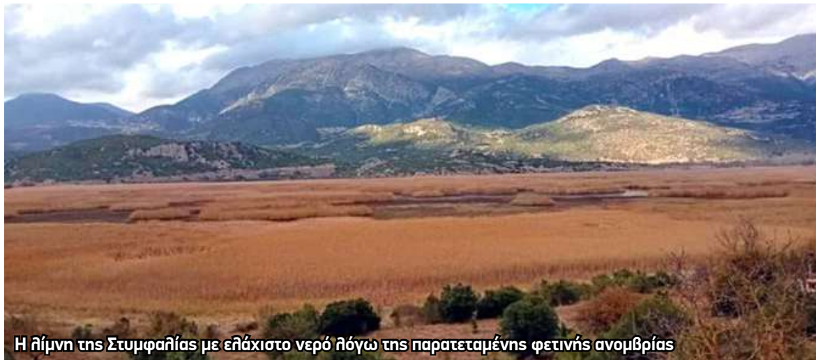
Η ήλιμη της Στυμφαλίας με ελάχιστο νερό λόγω της παρατεταμένης φετινής ανομβρίας

Ο πόλεμος για το νερό ξεκίνησε, αλλά εμείς δεν τον πήραμε χαμπάρι