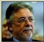
Του Γιάννη Πανούση, καθηγητή Εκκληματολογίας στο Πανεπιστήμιο Αθηνών

«Δεν μπορείς να συλλάβεις έναν άνθρωπο επειδή κάποιος τον δείχνει με το δάκτυλό του»