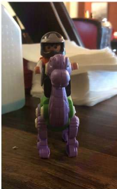
Συνάντηση με το Νάσερ

Τον ρώτησε ένας συνάδελφος μετά από ένα πετυχημένο και κουραστικό χειρουργείο.