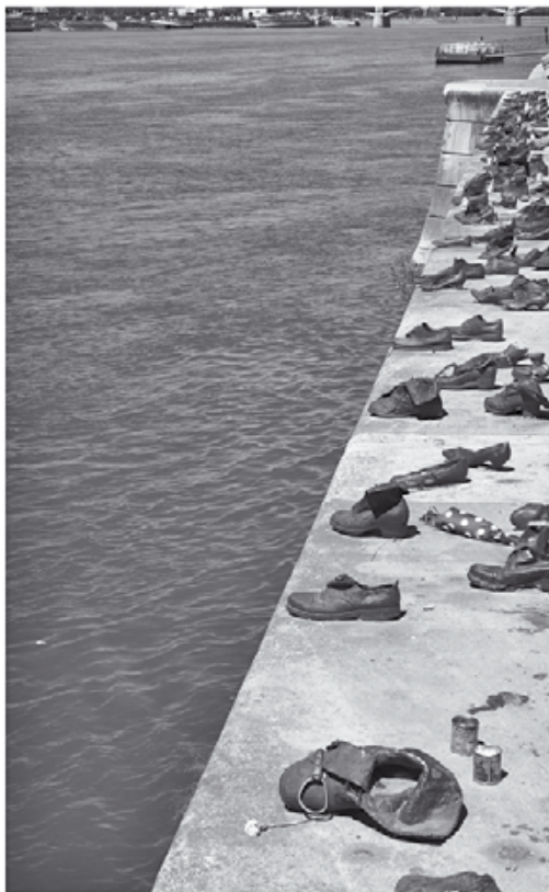
Αντιφασιστικό μνημείο στην Βουδαπέστη. 17 Μαΐου 1944 ... 80 χρόνια αιμώρητο έγκλημα

Άνοιξη του σαράντα τέσσερα, ανεπιβεβαίωτες φήμες έλεγαν ότι οι αγκυλωτοί σταυροί που μάτωσαν τον κό-