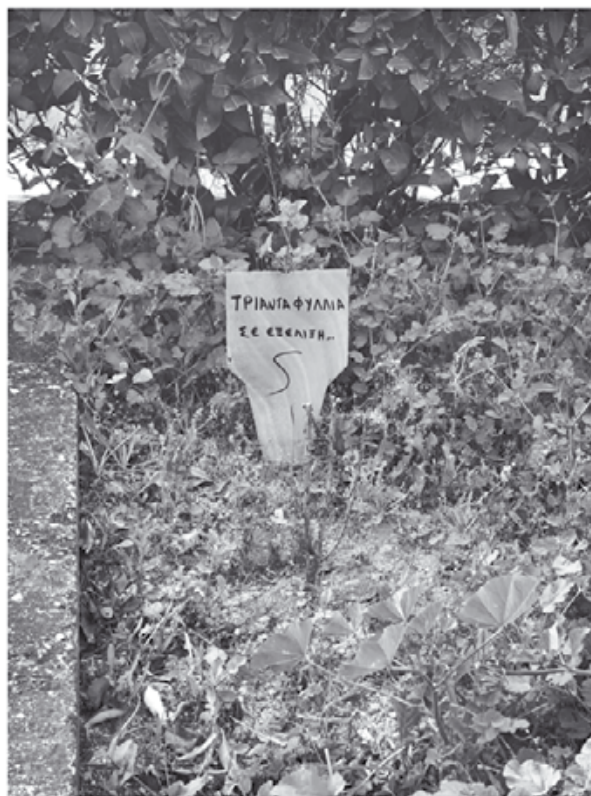
Το καβούκι πιστώ φέροντες...

Αυτή η αντανακλαστική κίνηση επιβίωσης τον έσωσε, πριν