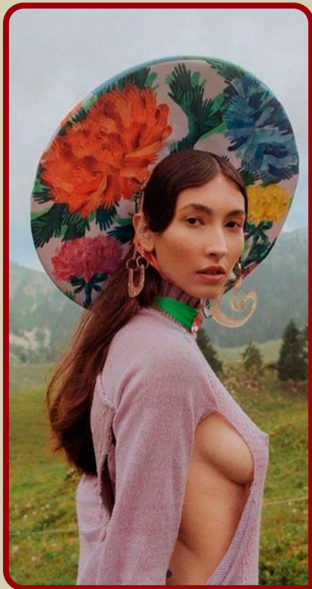
Ένα καπέλο θα προστατέψει το πρόσωπό σας από την υπέρυθρη ακτινοβολία

Ένας Έλληνας πεθαίνει και φτάνει στη ρεσεψιόν της Κόλασης. Ο υπάλληλος του ανακοινώνει ότι επειδή είναι υπήκοος χώρας-μέλους της Ευρωπαϊκής Ένωσης, μπορεί να διαλέξει μία από τις κολάσεις των χωρών-μελών. Σκέφτεται λίγο και αποφασίζει να πάει στη Γερμανική: