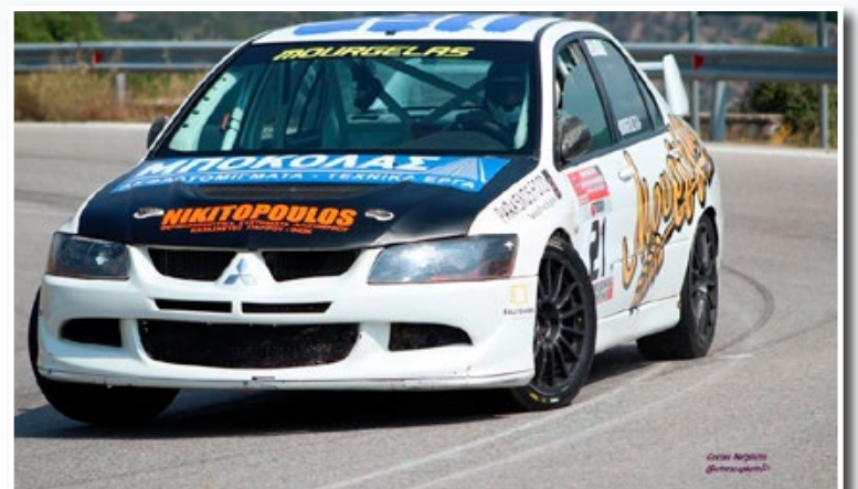
Τις υπέροχες στιγμές του αγώνα κατέγραψε με τη φωτογραφική του μηχανή ο Κώστας Ναυπλιώτης