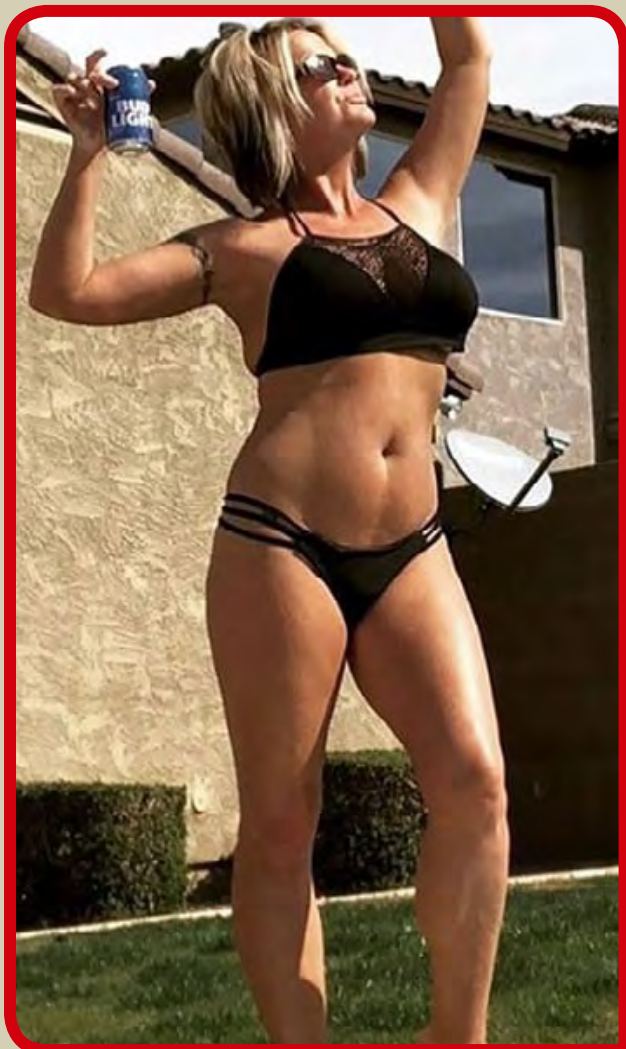
Σεπτέμβριος, ο μήνας των φτηνών και καλών διακοπών

- Σοβαρά;;; Απίστευτο!! Αν είναι δυνατόν!! Να δείτε που στο τέλος θα σας πεί και ότι έτρεχα κιόλας..!!!