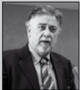
Του Πάνου Πανούση, καθηγητή Εγκληματολογίας στο Πανεπιστήμιο Αθηνών

«Δεν μπορείς να συλλάβεις έναν άνθρωπο επειδή κάποιος τον δείχνει με το δάκτυλό του»