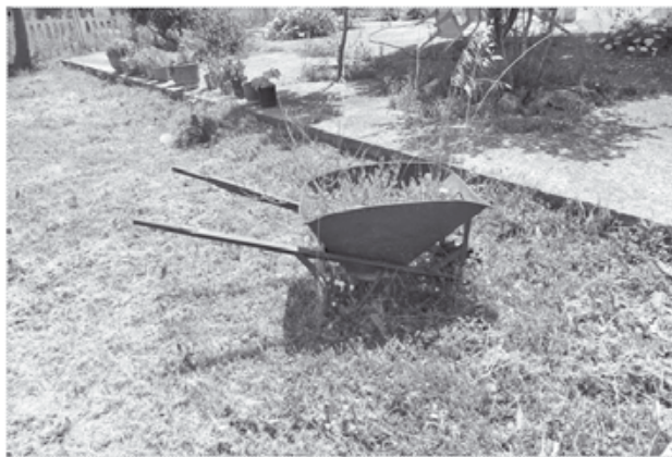
Το αυτοάνοσο σεντόνι...

-Δεν είναι αστέιο κυρ Βασίλη. Το παιδί «έμεινε» μπροστά