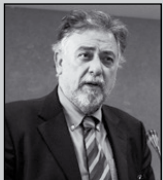
Του Πάνου Πανούση, καθηγητή Εγκληματολογίας στο Πανεπιστήμιο Αθηνών

«Δεν μπορείς να συλλάβεις έναν άνθρωπο επειδή κάποιος τον δείχνει με το δάκτυλό του»