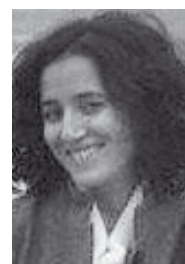
Της Αθηνάς Νάσσου,

Το 2-1 έγινε στο 60 λεπτό του παιχνιδιού με σουτ του Μαρουκάκη από το ύψος της μικρής περιοχής.