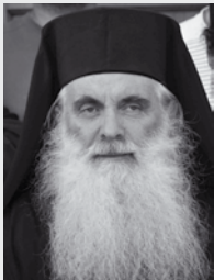
του Μητροπολίτη Αργολίδος Νεκταρίου

«Τι ζητείτε τὸν ζῶντα μετὰ τῶν νεκρῶν; οὐκ ἔστιν ὧδε, ἀλλ' ἠγέρθη». Τὴν ἡμέρα τῆς Ἀναστάσεως, βαθιά χαράματα, ἦλθαν γυναῖκες στὸ μνημα τοῦ Ἰησοῦ, φέροντας ἀρώματα, ποὺ εἶχαν ἐτοιμάσει, γιὰ νὰ προσφέρουν στὸν νεκρὸ Διδάσκαλό τους. Βρῆκαν τότε, τὴν πέτρα, ποὺ ἔφραζε τὸ μνη-