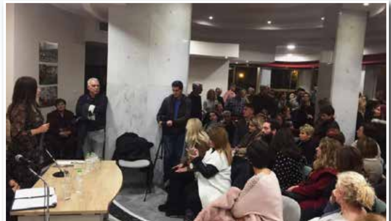
Σύντομα αναμένουμε την υποψηφιότητα της κα. Φλέσσα στο ευρωπαϊκό δέλτιο της ΝΔ