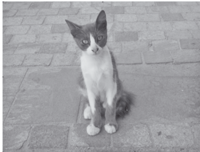
Ψέματα ή αλήθεια ;

*Η ιστορία στηρίχθηκε σε πραγματικά γεγονότα μας τα διηγήθηκε η μαμά της Μαρίας έβαλε και η φαντασία το κεράκι της.