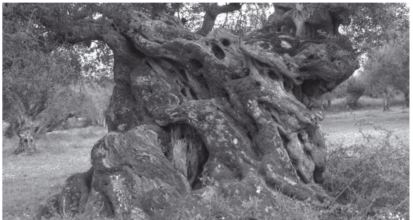
Ελιά 2.500 χρόνων στο Αγριλόβουνο Διαβολιτσίου Μεσσηνίας. Η περίμετρος στη βάση είναι 12 μέτρα! // Β.Μ.