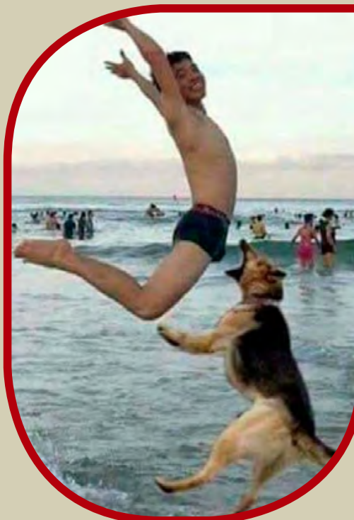
όμως, καλά είναι, έ;

- Α, λέει ο Τοτός, δεν θέλεις να την βγάλω... Όταν την τρως