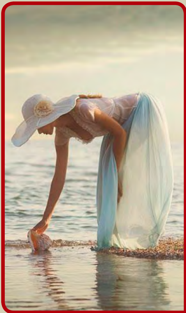
Που θα πάει, δεν θα φτάσει τους 20;