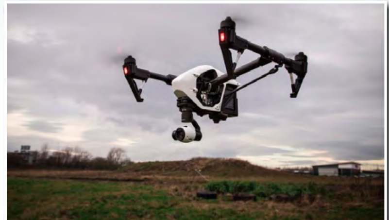
Η ΛΕΑΓΟΣ διαθέτει πιστοποιημένο χειριστή μη επανδρωμένου αεροσκάφους για εναέρια παρατήρηση και εφαρμογή ψεκασμού