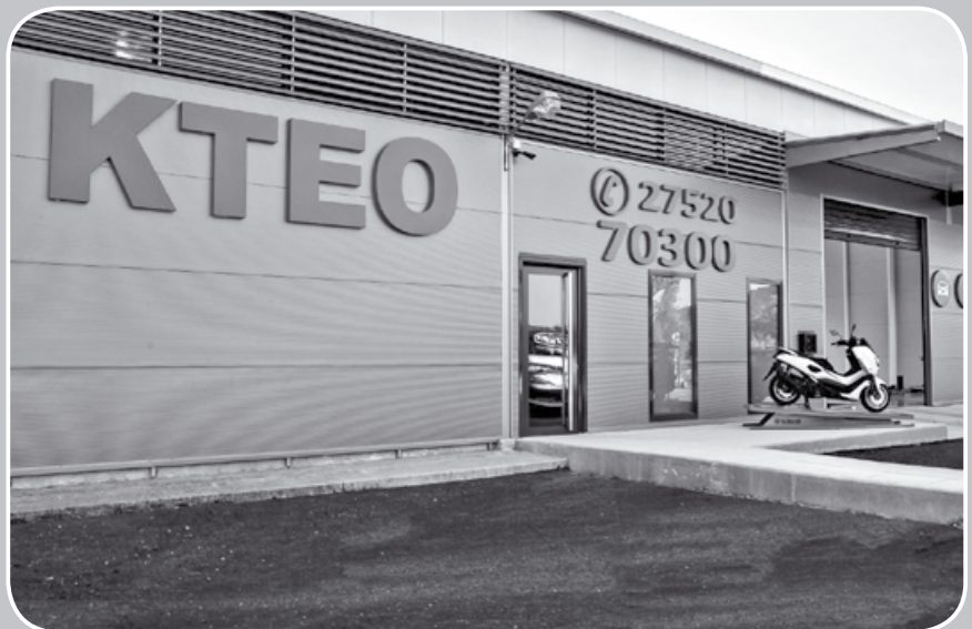
Ι.ΚΤΕΟ ΔΡΟΜΟΣ. Τεχνικός έλεγχος Οχημάτων. Η φιλικότητα του ανθρώπινου δυναμικού του, η ζεστασιά του καλόγουστα σχεδιασμένου και ιδιαίτερα προσεγγμένου περιβάλλοντός του και οι υπερσύγχρονες γραμμές αυτόματου ελέγχου είναι μόνο μερικά από τα στοιχεία εκείνα που θα σας πείσουν να το επισκεφθείτε. Βρίσκεται στα Βακούφια Αγίου Ανδριανού, στο Ναύπλιο. Τηλ. 27520 70300

Ο «Αναγνώστης Πελοποννήσου» στηρίζει και προβάλλει την τοπική αγορά, τις ντόπιες επιχειρήσεις, τους αξιόλογους επαγγελματίες, που κέρδισαν την εμπιστοσύνη μας... Μαζί προσπερνάμε την κρίση και επιχειρούμε μέσα από αυτή τη σελίδα να παρουσιάσουμε