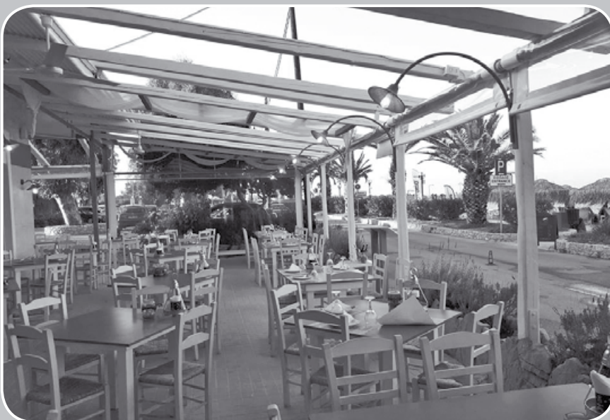
ΙΣΑΛΟΣ ΚΙΒΕΡΙ. Υπέροχες γεύσεις φαγητών, εξυπηρετικό προσωπικό, προσιτές τιμές, σε μια υπέροχη τοποθεσία. Είτε μεσημέρι, είτε βράδυ αξίζει να το επισκεφθείτε. Βρίσκεται στο Κιβέρι. Τηλ. 2751 042255