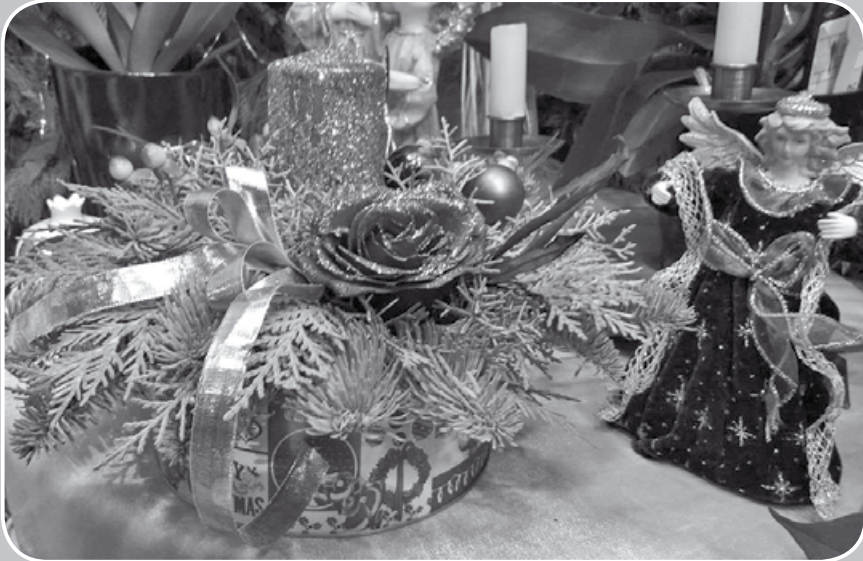
BONSAI ΑΝΘΟΠΩΛΕΙΟ. Το ανθοπωλείο που ξέρει τα πάντα γύρω από το λουλούδι και ανακαλύπτει τις προτιμήσεις σας. Βρίσκεται στην οδό Βαρβάκη Ιωάννη 6, στο Ναύπλιο. Τηλ. 27520 25351