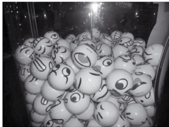
Καμία φορά χάνεις για να κερδίσεις...

Διαγώνια απέναντι ήταν το μαγαζί του, διατηρούσαν εδώ και χρόνια μια επαγγελματική λυκοφιλία.