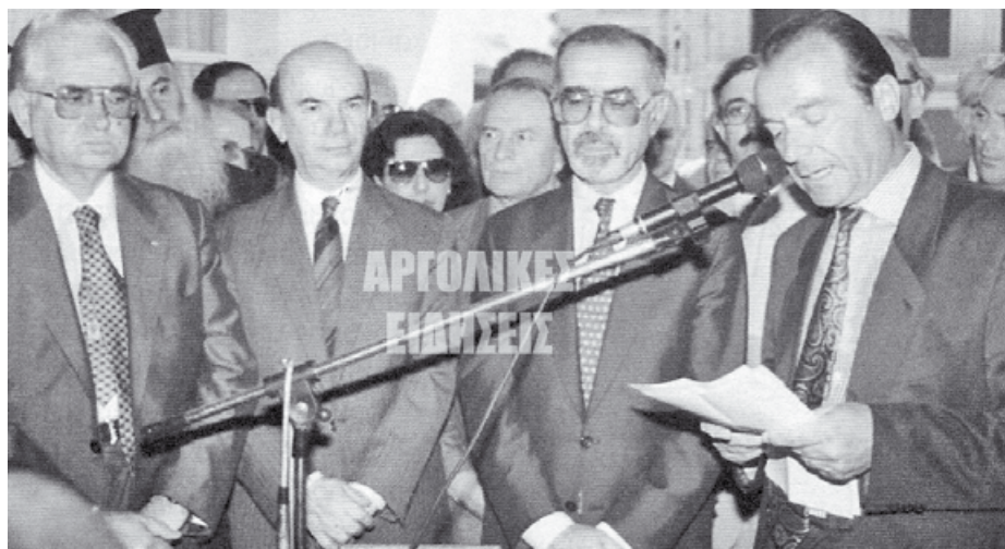
Διατηρούσε σχέσεις με τον Γιώργο Τσούρνο, στο Ναύπλιο

Στο Ειδικό Δικαστήριο ο Κόκκινος ψήφισε υπέρ της ενοχής του Ανδρέα Παπανδρέου και για τις τρεις κατηγορίες που αντιμετώπιζε, τελικά όμως ο Παπανδρέου αθώωθηκε και για τις τρεις (για την μία με ψήφους 7-6). Ο Κόκκινος μάλιστα ήταν αυτός που ζήτησε καταδίκη του τέως πρωθυπουργού.