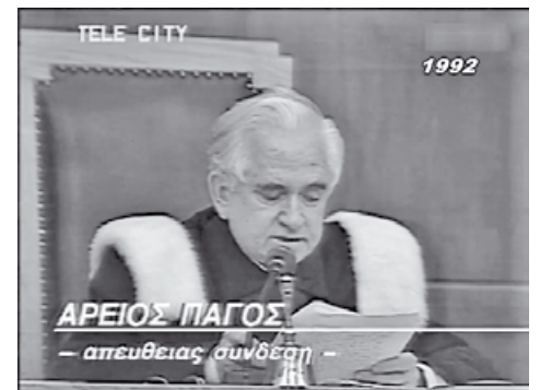
Ο Βασίλης Κόκκινος ως πρόεδρος του Αρείου Πάγου στο Ειδικό Δικαστήριο ψήφισε υπέρ της ενοχής του Ανδρέα Παπανδρέου και για τις τρεις κατηγορίες που αντιμετώπιζε

συνάδελφό του δικαστή Στέφανο Μαθθία, που ήταν ο διάδοχός του στην προεδρία του Αρείου Πάγου. Ο Μαθθίας σε άρθρο του υποστήριξε ότι «είναι απαράδεκτο τον 21ο αιώνα η ελληνική Δικαιοσύνη να βρίσκεται υπό εκκλησιαστική κηδεμονία» και σπλίτευσε πρακτικές όπως το να γίνεται αγιασμός κατά την έναρξη του δικαστικού έτους ή να συμμετέχουν ιερείς σε εκδηλώσεις του δικαστικού σώματος. Ο Κόκκινος κατηγορήσε τον Μαθθία για αυτές του τις απόψεις και υποστήριξε ότι είναι επίορκος.