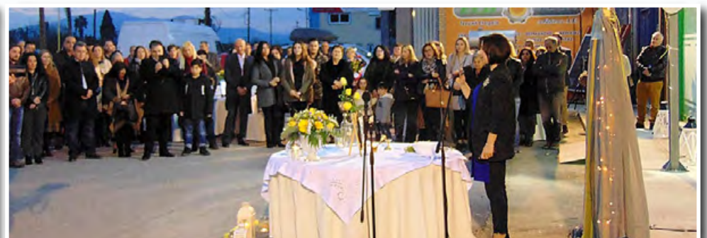
Τα εγκαίνια της Φαρμακαποθήκης «VD Hellas PharmaCon» πραγματοποιήθηκαν στις νέες εγκαταστάσεις της εταιρίας στο 5ο χλμ. Άργους-Ναυπλίου