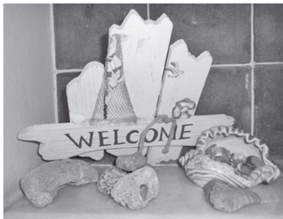
Δώρο στην μαμά..... μια φορά φτάνει!

-Μετά τις τρεις έχω πολύ δουλειά ακόμα. Είσαστε καλά; (Ρώτησε ανήσυχ.)