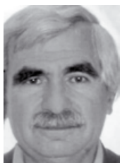
Του Χρήστου Πιτερού*

Το δεύτερο έτος της Ελληνικής Επανάστασης (1822), μετά τις πρώτες νίκες των ραγιάδων κατά των Τούρκων, ήταν καθοριστικής σημασίας για το στέριωμα της επανάστασης. Η καταστροφή του Δράμαλη στα Δερβενάκια και το Αγιονόρι στις 26 - 29 Ιουλίου 1822 με την στρατηγική μεγαλοφυΐα του Γέρου του Μοριά, με τα πλούσια λάφυρα σε άρματα και γρόσια και η κατάληψη του Παλαμπίου, ακριβώς μετά από τέσσερις μήνες, με μια αστραπιαία ηρωική παλληκαρική - ρεσάλτο μέσα στη σκοτεινή και βροχερή νύχτα της 29ης - 30ης Νοεμβρίου του ατρόμπτου πολιορκητή του Ναυπλίου, μόλις 24 ετών, Σταϊκού Σταϊκόπουλου αποτέλεσαν τα νικητήρια τρόπαια των Ελλήνων. Το γενναίο αποφασισμένο, εικοσάχρονο παλληκάρι από τα Μοσχονήσια, ο Δημήτριος Μοσχονησιώτης που έπαιξε τη ζωή του κορώνα - γράμματα μέσα στη νύχτα, ανέβηκε την ξύλινη σκάλα και πήδησε μέσα στα τείχη του άπартου κάστρου από την ανατολικότερη και χαμηλότερη «Γιουρούς - Τάπια» (Αχιλλέας), εξουδετέρωσε αστραπιαία τον Τούρκο φρουρό και άνοιξε το δρόμο της Ελευθερίας για να ανεβούν στο κάστρο ο Σταϊκόπουλος με τα παλληκάρια του.