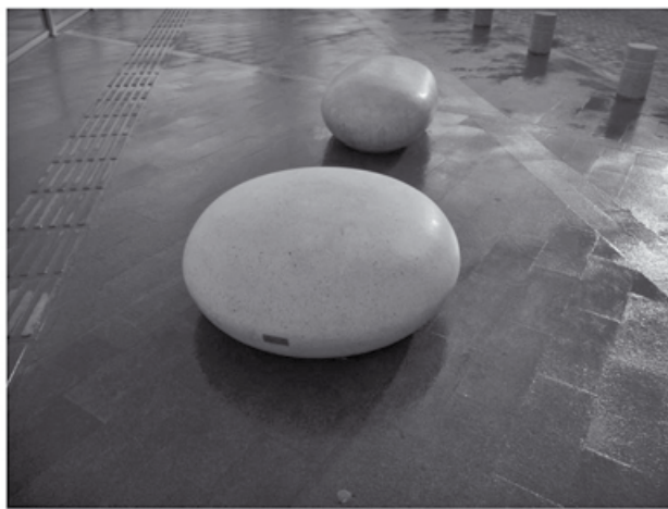
Τρωκτικά απόβλητα ροκανίζουν τα φτερά μας...

-Φεύγω, θα πάω στο νησί του παππού μου. Αυτοεξορία είναι η αντίσταση μου.