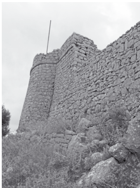
Η Γιουρούς Ντάπια με το τείχος

Ο Κολοκοτρώνης άκουσε τις ντουφεκίες από