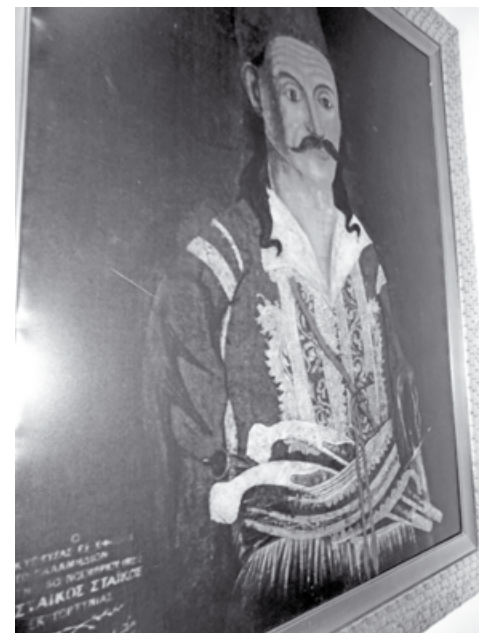
Αφηρωισμένο πορτρέτο του Σταϊκόπουλου (1888)

Ο Δημήτριος Μοσχονησιώτης που έπαιξε τη ζωή του κορώνα - γράμματα μέσα στη νύχτα, εξουδετέρωσε τον Τούρκο φρουρό και άνοιξε το δρόμο της Ελευθερίας