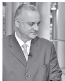
Μανώλης Κεφαλογιάννης (Ευρωβουλευτής της ΝΔ (ΕΛΚ) και επικεφαλής της Κοινοβουλευτικής Ομάδας της ΝΔ στο Ευρωπαϊκό Κοινοβούλιο):

Το ερώτημα αυτό θέσαμε σε τέσσερις Έλληνες ευρωβουλευτές διαφορετικών πολιτικών αποχρώσεων, οι απαντήσεις των οποίων δείχνουν μια εντελώς διαφορετική θεώρηση των πραγμάτων και διαφορετική ερμηνεία των αιτίων.