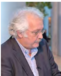
Σωτήρης Ζαριανόπουλος (Ευρωβουλευτής του ΚΚΕ):

Αυτή τη στιγμή, η κοινωνική και πολιτική κρίση η οποία ξεκίνησε από τις χώρες του νότου, έχει φτάσει στις χώρες του Βορρά και βλέπουμε φαινόμενα και κοινωνικής ένδειας και φτώχειας, αλλά και πολιτικής αποσταθεροποίησης στις χώρες του Βορρά. Βλέπουμε ότι ο Μακρόν έχει πρόβλημα με την πολιτική του επιρροή, το παλιό Γαλλικό πολιτικό σύστημα κατέρρευσε πλήρως, τώρα βλέπουμε στη Γερμανία ότι υπάρχει πολιτική αποσταθεροποίηση, δεν μπορεί να κυβερνήσει η Μέρκελ, η οποία αμφισβητείται πάρα πολύ έντονα. Δηλαδή, για τις κυρίαρχες δυνάμεις της Ευρώπης, αυτή η πολιτική της λιτότητας που εφάρμοσαν τα προηγούμενα χρόνια, τους γυρνάει σαν μπουμερανγκ τώρα. Τις κτυπάει τις ίδιες.