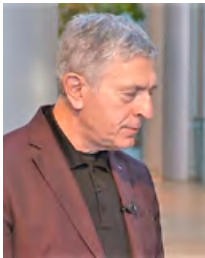
Στέλιος Κούλογλου (Ευρωβουλευτής του ΣΥΡΙΖΑ, Συνομοσπονδιακή Ομάδα της Ευρωπαϊκής Ενωτικής Αριστεράς / Αριστερά των

αστής, μέχρι οτιδήποτε; Αυτά χρειάζονται πάρα πολύ μυαλό; Αλλά εδώ πρέπει να ανοίξουμε την καρδιά μας και το μυαλό μας. Δεν ζούμε έχοντας τα μάτια μας στον προ-προηγούμενο αιώνα του μαρξισμού και του λενινισμού. Ούτε ο Μάξ, ούτε καλά - καλά ο Λένιν, αν δεν είχαν στο μυαλό τους μόνο την επανάσταση, δεν θα ήταν σήμερα ούτε μαρξιστές, ούτε λενινιστές. Οραματιζόμαστε μια χώρα που το πιο φτωχό παιδί μέσα σε μια γενιά, θα μπορέσει να ικανοποιήσει όλες του τις φιλοδοξίες και θα προσφέρει στον τόπο του και στην Ευρώπη τα μέγιστα, ξεκινώντας από το πιο απομακρυσμένο χωριό και διοικώντας την Ευρώπη.