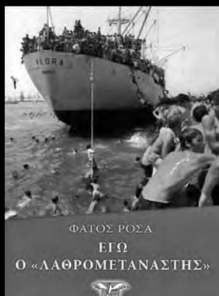
ΦΑΤΟΣ ΡΟΣΑ ΕΓΩ Ο «ΛΑΘΡΟΜΕΤΑΝΑΣΤΗΣ»

Σύμφωνα με τους διοργανωτές «Την ίδια ώρα που οι ανιστόρητοι έβγαζαν εθνικιστικές κορόνες και δίχαζαν για μια ακόμα φορά τους πολίτες του δήμου Άργους χωρίζοντάς τους σε προδότες και σούπερ πατριώτες, από το εργατικό κέντρο του Άργους ακουγόταν η φωνή