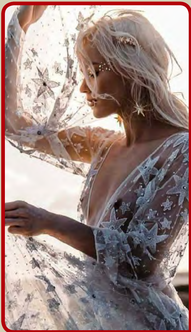
Πιο νωρίς εφέτος άρχισε ο χριστουγεννιάτικος στολισμός