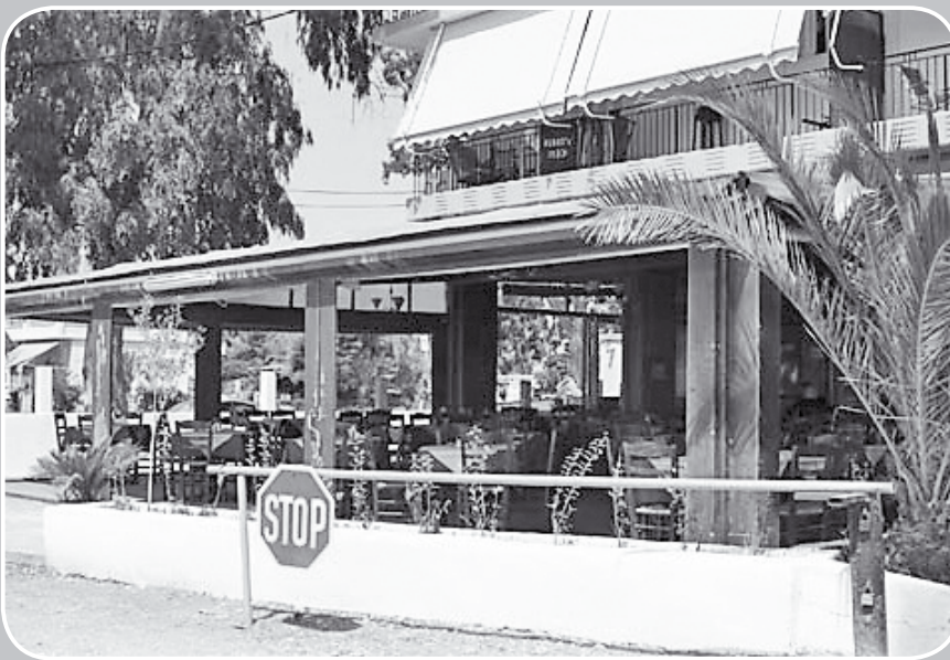
ΨΑΡΟΤΑΒΕΡΝΑ ΤΣΑΚΙΡΗΣ. Η γεύση αγκυροβολεί εδώ... Η ψαροταβέρνα σας περιμένει να απολαύσετε ένα υπέροχο γεύμα. Φρέσκα ψάρια, παραδοσιακή κουζίνα και ποιότητα θα σας χαρίσουν μια υπέροχη εμπειρία. Βρίσκεται στην Παραλία της Νέας Κίου (Τημέλιο). Τηλ.: 2751 051058