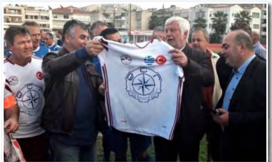
Από πολιτική, όσο και από ποδόσφαιρο μας έβαλαν τα γυαλιά οι Τούρκοι