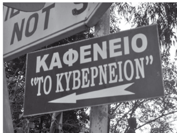
...και μην ξεχνάμε : οι άριστοι μπροστά...

“ Επαγγελματίας αγωνιστής του λαού και αυτός έπρεπε να είναι μαζί με τον κόσμο. Από καφενεύο σε καφενεύο, όλη μέρα έσβηνε την επαναστατική του κάψα, χειμώνα καλοκαίρι, με παγωμένες μπίρες. Τα βράδια μετά από τόση κούραση, στα γραφεία του κόμματος χαλάρωνε με καλό ούισκι, κουβανέζικο πούρο και ακούγοντας αντάρτικα τραγούδια.