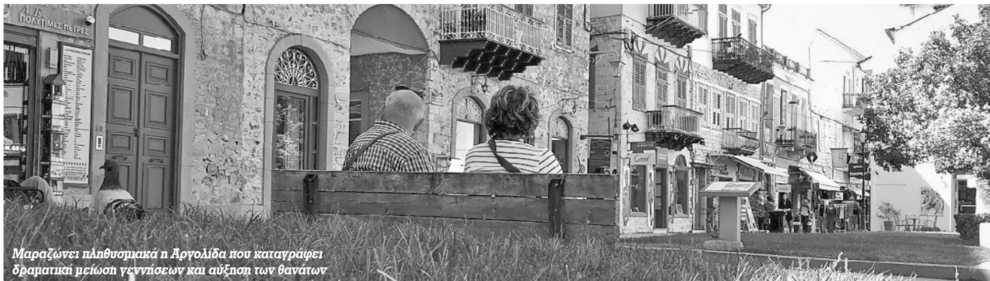
Μαραζώνει πληθυσμικά η Αργολίδα που καταγράφει δραματική μείωση γεννήσεων και αύξηση των θανάτων