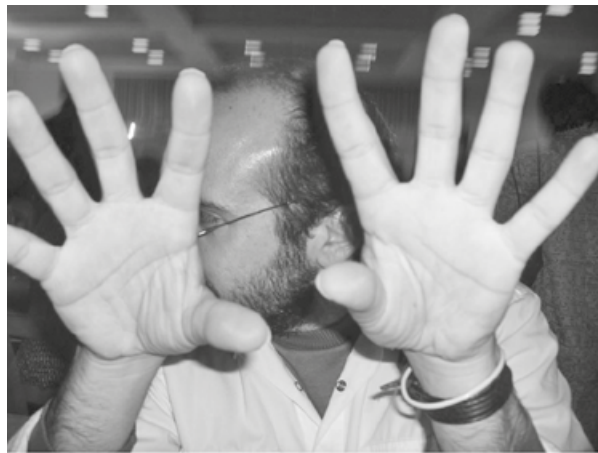
Ο Αλφαχί σχολιάζοντας την πολιτική επικαιρότητα...

σωματοφύλακες οι οποίοι ήταν εναλλάξ και οδηγοί του. Δεν πρόλαβε να κάτσει όταν χτύπησε το κινητό τηλέφωνο. Ένα λεπτικό τσουνάμι ταρακούνησε το αίθριο του εστιατορίου. Ποιος είδε τον Θεό και δεν φοβήθηκε. Σε άπαιστα αγγλικά έβριζε θεούς και δαίμονες, για κάποιο μεγάλο ποσό που έπρεπε