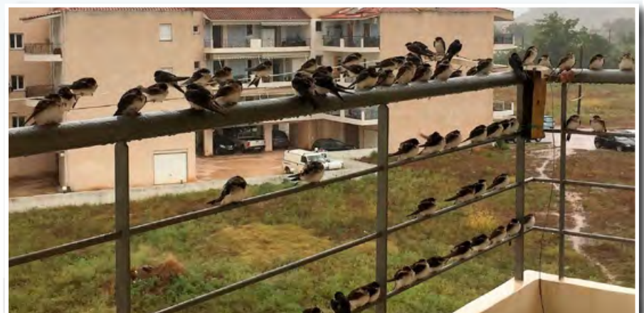
Και μια όμορφη εικόνα, αποτέλεσμα όμως της κακοκαιρίας και αυτή: Χελιδόνια που δεν πρόλαβαν να φύγουν, βρήκαν καταφύγιο σε μπαλκόνια σπιτιών στις πόλεις του νομού