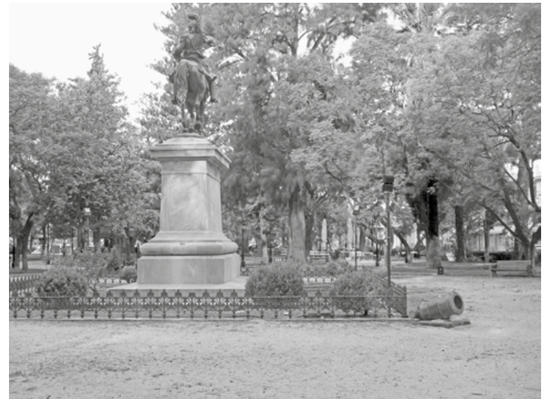
Το άγαλμα του Κολοκοτρώνη περικυκλωμένο από τα δέντρα

αυτονόπτα για τους κατοίκους του Ναυπλίου, μιας ιστορικής πόλης. Η μελέτη ανάπλασης του πάρκου Κολοκοτρώνη γιατί δεν συμπεριλαμβάνει και την μελέτη ανάπλασης της πλατείας Ι. Καποδίστρια, που βρίσκεται σε άμεση σχέση με τους άναρχα φυτρωμένους φοίνικες και τα αιωνόβια δέντρα, πεύκα κ.λπ., από τα οποία πέφτουν συχνά κλαδιά και εγκυμονούν σοβαρούς κινδύνους στα παιδιά που παίζουν στις παιδικές χαρές;