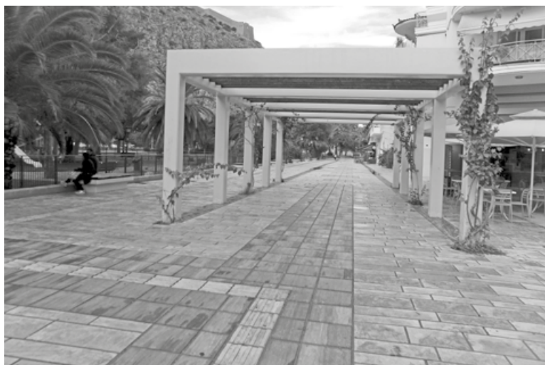
«Πέργκολα» στον πεζόδρομο Β. Κων/νου

θα γίνει ανάπλαση του πάρκου Θ. Κολοκοτρώνη καθώς και ότι εκπονείται σχετική μελέτη. Ωστόσο κανείς από τους αρμόδιους της Δημοτικής Αρχής, ούτε ο Δήμαρχος κ. Δ. Κωστούρος έχει ενημερώσει τους πολίτες και τηρείται σιγή γύρω από αυτό το θέμα. Προφανώς οι εκπρόσωποι της Δημοτικής Αρχής δεν έχουν συνειδητοποιήσει στην πράξη ότι η πόλη και τα πάρκα ανήκουν στους πολίτες. Πρόσφατα διέρρευσε η πληροφορία ότι έχει συνταχθεί μελέτη που αλλάζει τα πάντα στο πάρκο Θ. Κολοκοτρώνη, καταργούνται τα παρτέρια, γίνονται μεγάλης έκτασης πλακοστρώσεις και προβλέπεται η εγκατάσταση μεγάλου αριθμού τραπεζοκαθισμάτων από τα γύρω καταστήματα. Η ευρείας έκτασης επεμβάσεις στο πάρκο το πιθανότερο θα προκαλέσουν αισθητική βλάβη στον ανδριάντα του Κολοκοτρώνη. Άγνωστο παραμένει ποιος είναι ο μελετητής της νέας διαμόρφωσης του πάρκου, καθώς επίσης και σε ποιό μελετητή έχει ανατεθεί η φυτοτεχνική μελέτη του πάρκου. Το πάρκο Θ. Κολοκοτρώνη θα παραμείνει ως ιστορικό πάρκο αναψυχής ή θα αλλάξει χρήση και γιατί; Είναι βασικά ερωτήματα