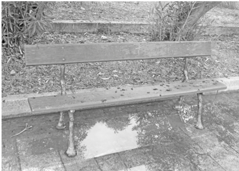
Παγκάκια του Πάρκου Κολοκοτρώνη

Το σημερινό ιστορικό πρόσωπο της πόλης διαμορφώθηκε με κύρια αιτία τον εορτασμό της επετείου της εκατονταετηρίδας της ανεξαρτησίας του Ελληνικού Κράτους, το έτος 1930. Το τότε Δημοτικό Συμβούλιο του Δήμου Ναυπλιέων υπό τον φωτισμένο και ικανότατο δήμαρχο Κων/νο Κόκκινο έγκαιρα αποφάσισε, μεταξύ άλλων, την ανάπλαση της ευρύτερης περιοχής της πόλης με την πολεοδόμησή της ως την Ενδεκάτη καθώς και την ανέγερση του ανδριάντα του πρώτου Κυβερνήτη Ι. Καποδίστρια, ο οποίος οργάνωσε το νέο ανεξάρτητο κράτος. Την πολεοδόμηση της πολυσήμαντης ιστορικής πόλης δεν την ανέθεσαν σε κάποιον αρχιτέκτονα αλλά στον αείμνηστο παγκοσμίως γνωστό αρχιτέκτονα και καθηγητή στο Ε. Μ. Πολυτεχνείο Δημήτριο Πικιώνη, ο οποίος διαμόρφωσε την πλατεία Ι. Καποδίστρια για την ανέγερση του ανδριάντα καθώς και το πάρκο Κολοκοτρώνη, όπου είχε σπηθεί ο έφιππος ανδριάντας του Θ. Κολοκοτρώνη από το 1901. Για την καθοριστικής σημασίας συμβολή στην πολεοδόμηση και ανάπλαση της πόλης πρότασή μας είναι ο πρόσφατα διαμορφωμένος πεζόδρομος - επέκταση της οδού Βασιλέως Κων/νου, κατά μήκος του πάρκου, να ονομασθεί πεζόδρομος Δημητρίου Πικιώνη, μία οφειλόμενη έκφραση ευγνωμοσύνης στον κορυφαίο αρχιτέκτονα. Σε δώδεκα χρόνια, το 1930 συμπληρώνονται εκατό χρόνια από την ανάπλαση