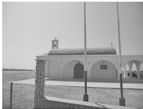
Το εκκλησάκι της Αγίας Θέκλης

“ Ο Μαστροπετρίης, άνθρωπος με σταθερές αξίες μέχρι ξεροκεφαλιάς παρέμεινε μάστορας όλα τα χρόνια και της ακμής και της παρακμής. Δεν ξανοίχτηκε όπως άλλα μαστόρια. Των περισσότερων μαστόρων τα μυαλά πήραν αέρα. Το διάφανο μπαλόνη με τα πολλά αεροριάλια* θολώνει το νου. Βλέποντας τον κόσμο μέσα από το πλαστικό παράθυρο γεμάτο καπιταλιστικό αέρα νομίζεις άλλα.