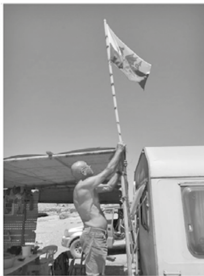
Στα εβδομήντα πέντε χρόνια του, καλημερίζει τον χρόνο, σηκώνοντας πεισματικά μια Ουαλέζικη σημαία, απέναντι από το στρατιωτικό Αγγλικό φυλάκιο του θαλάσσιου πεδίου βολής.