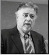
Του Γιάννη Πανούση, καθηγητή Εγκληματολογίας στο Πανεπιστήμιο Αθηνών

«Δεν μπορείς να συλλάβεις έναν άνθρωπο επειδή κάποιος τον δείχνει με το δάκτυλό του»