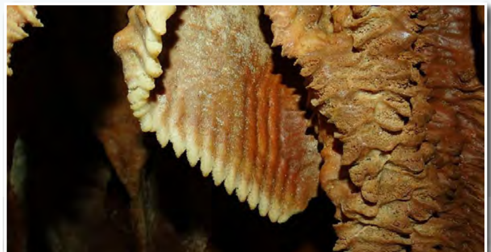
Εντυπωσιακό χτένι από ασβεστολιθικό πέτρωμα