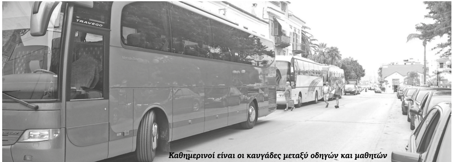
Καθημερινοί είναι οι καυγάδες μεταξύ οδηγών και μαθητών

Σύμφωνα με όσα λέει στον ΑΝΑΓΝΩΣΤΗ ΠΕΛΟΠΟΝΝΗΣΟΥ ο κος Δουβίκας «η ευθύνη ανήκει στην Πολιτεία, που δεν έγινε εγκαίρως ο διαγωνισμός». Ακόμη και σε μήνυση κατά παντός υπευθύνου προσανατολίζεται η ΚΤΕΛ ΑΡΓΟΛΙΔΑΣ, υποστηρίζοντας ότι η διαδικασία του διαγωνισμού που έγινε από την Περιφέρεια Πελοποννήσου για τη μεταφορά μαθητών, δεν ξεκίνη-