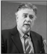
Του Γιάννη Πανούση, καθηγητή Εγκληματολογίας στο Πανεπιστήμιο Αθηνών

«Δεν μπορείς να συλλάβεις έναν άνθρωπο επειδή κάποιος τον δείχνει με το δάκτυλό του»