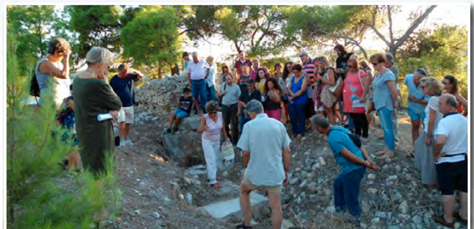
Από το 2012 και κάθε χρόνο αδιαλείπτως το ΙΛΜΕ, το μήνα Αύγουστο, οργανώνει έναν εξαιρετικού ενδιαφέροντος ιστορικό περίπατο