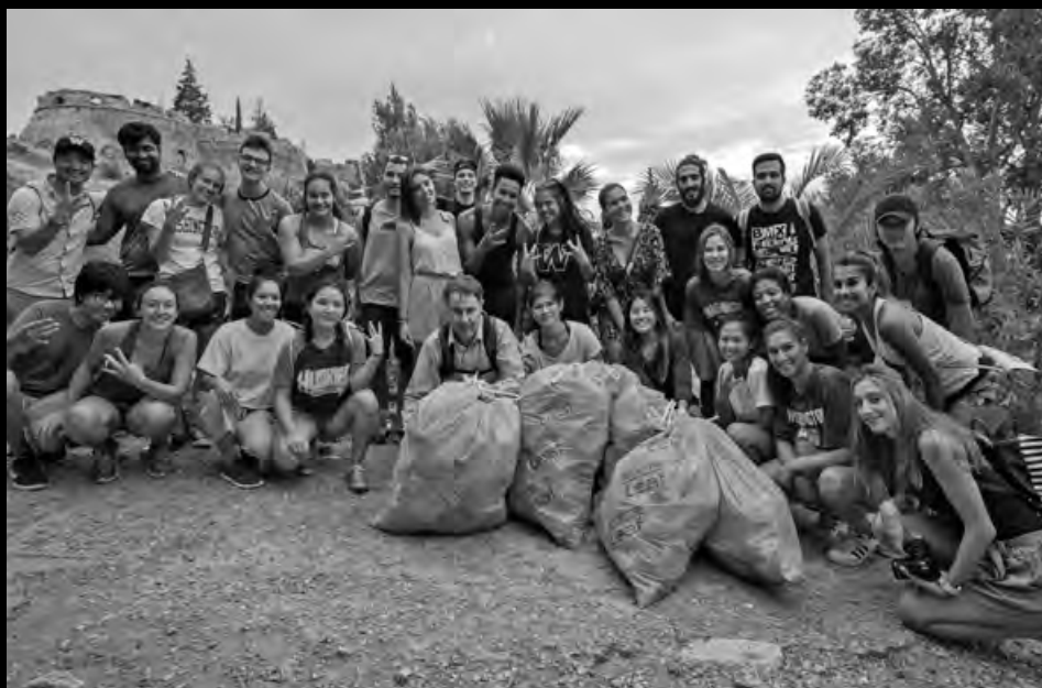
"Καθαρίζοντας τα σκαλιά του Παλαμηδίου. Πρωτοβουλία εναισθητοποίησης των πολιτών"

Στόχος του ίδιου του προγράμματος δεν είναι μόνο η επαφή των φοιτητών με τις μειονοτικές ομάδες της περιοχής και η υλοποίηση ερευνών αλλά, κυρίως, η παροχή έμπρακτης βοήθειας μέσω διαφόρων