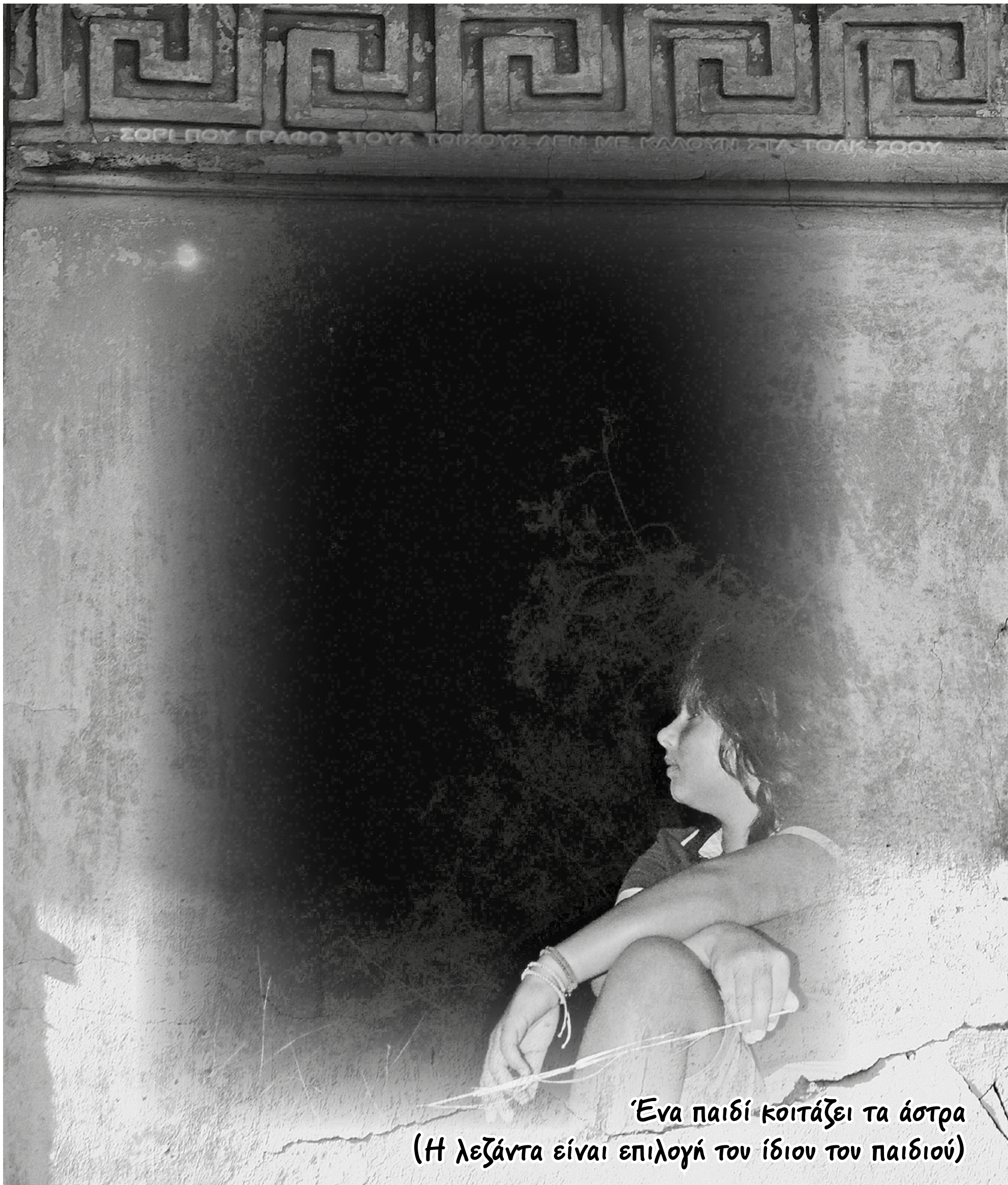
Ένα παιδί κοιτάζει τα άστρα (Η λεζάντα είναι επιλογή του ίδιου του παιδιού)