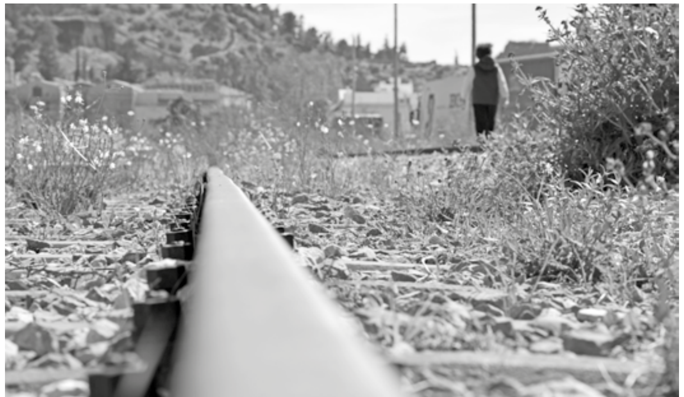
Περίπατος στις γραμμές του τρένου

γίνα. Κάθε χρόνο ο Δήμος Άργους Μυκηνών υλοποιεί το όνειρο εκατοντάδων μαθητών του δήμου μας, ιδιαίτερα σε αυτή την περίοδο της μεγάλης οικονομικής κρίσης. Είναι γεγονός, πως χωρίς την συνδρομή του δήμου, η πολιτισμική ανταλλαγή μαθητών δεν θα γινόταν, λόγω οικονομικής αδυναμίας των οικογενειών τους.