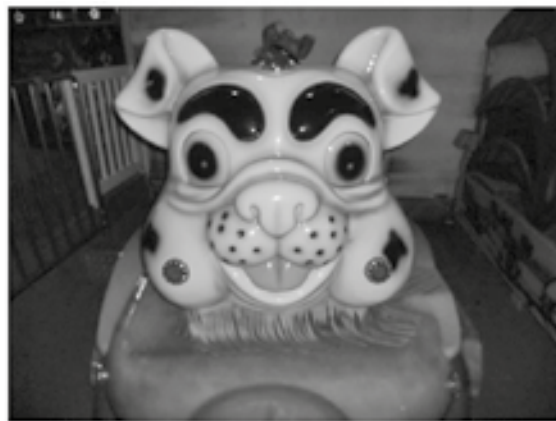
Τι να πούμε στα παιδιά... άλλη μια φορά... Τα ξέρουν όλα...