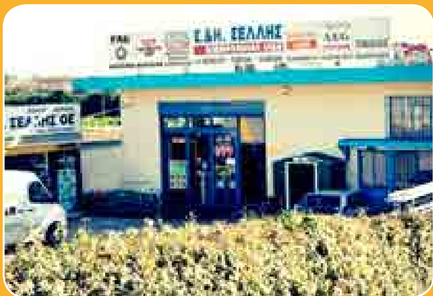
ΣΕΛΛΗΣ ΒΙΟΜΗΧΑΝΙΚΑ ΕΙΔΗ. Επαγγελματίες στα βιομηχανικά είδη σε ασυναγώνιστες τιμές. Βρίσκεται στην οδό Α. Μιαούλη, στο Άργος. Τηλ.: 2751 062650

Ο «Αναγνώστης Πελοποννήσου» στηρίζει και προβάλλει την τοπική αγορά, τις ντόπιες επιχειρήσεις, τους αξιόλογους επαγγελματίες, που κέρδισαν την εμπιστοσύνη μας... Μαζί προσπερνάμε την κρίση και επιχειρούμε μέσα από αυτή τη σελίδα να παρουσιάσουμε