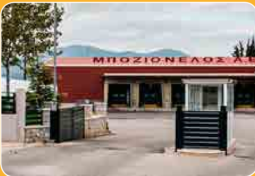
ΜΠΟΖΙΟΝΕΛΟΣ. Από το 1961 στην εισαγωγή, εμπορία και επεξεργασία νωπών και κατεψυγμένων τροφίμων, με γνώμονα την παροχή της υψηλότερης ποιότητας, στην καλύτερη τιμή με την καλύτερη εξυπηρέτηση. Βρίσκεται στην Ακοβα Άργους. Τηλ.: 27510 69183