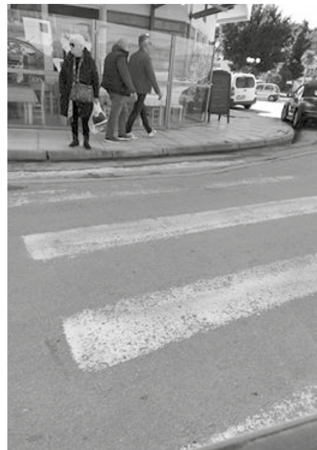
Σε πολλές διαβάσεις απουσιάζουν οι ράμπες