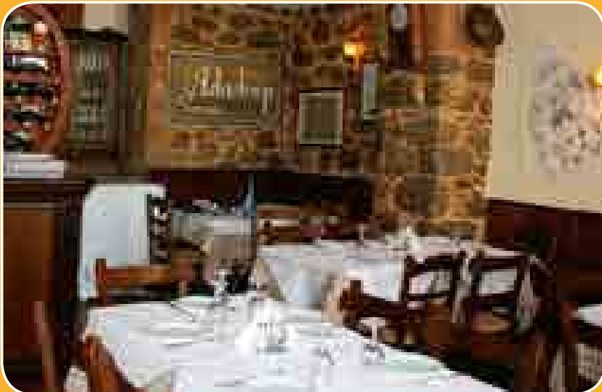
ΑΛΛΑΟΥΜ. Εξαιρετικά φαγητά, μεγάλες μερίδες, πολύ λογικές τιμές και πολύ ευγενικοί σερβιτόροι. Βρίσκεται στην οδό Δημ. Υψηλαντου 13, στο Ναύπλιο. Τηλ.: 2752 029883