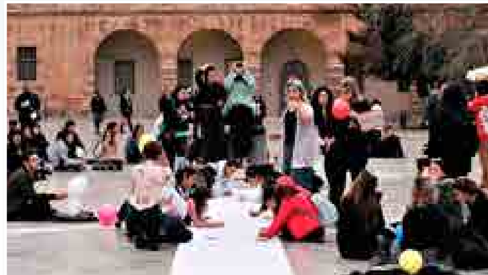
Με τον δικό τους τρόπο τα παιδιά τέθηκαν αλληλέγγυα στην σχολή θεατρικών σπουδών