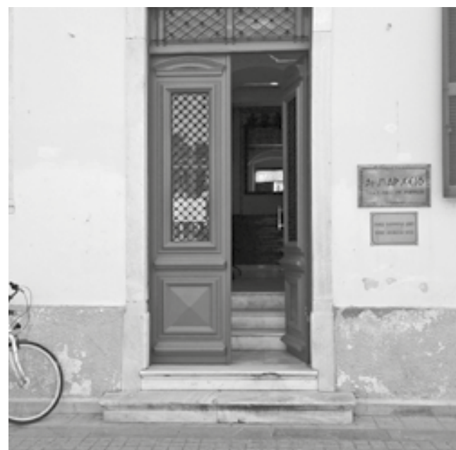
Στο δημαρχείο δεν μπορεί να πάει κάποιος με κινητικά προβλήματα