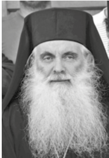
Το βιβλίο είναι ένα σκιαγράφημα της ζωής του Παΐσιου, που επικεντρώνεται κυρίως σ' αυτά που αφορούν περισσότερο τα νέα παιδιά, σημειώνει ο συγγραφέας

Ήταν ένα ζεστό απόγευμα όταν κίνησα για να βρω τον π. Παΐσιο στο φτωχικό σπιτάκι του. Έμενε τότε κοντά στη μονή Σταυρονικήτα, στο κελί του Τιμίου Σταυρού. Το μονοπάτι που οδηγούσε στο σπίτι του ήταν μέσα σε πολύ πυκνό δάσος, με κάπως χαμηλή βλάστηση. Τα δέντρα μπερδεύονταν με τα αναρριχώμενα φυτά και τα είχαν ενώσει τόσο πολύ μεταξύ τους, ώστε σε κάποια σημεία οι μοναχοί είχαν αναγκαστεί να τα κόψουν είτε με πριόνια είτε με μεγάλα ψαλίδια για να ανοίξουν δίοδο. Ήμουν πολύ χαρούμενος κι έτρεχα να φτάσω όσο γίνεται γρηγορότερα κοντά στον αγιασμένο γέροντα. Και να το πρώτο εμπόδιο. Καταμεσής στο μονοπάτι βλέπω έντρομος μια οχιά κουλουριασμένη, να έχει υψώσει το κεφαλάκι της, να 'χει βγάλει τη γλωσσίτσα της και να με περιμένει σε θέση άμυνας για να την... επίθεση. Τρόμαξα, βρέθηκα σε αμηχανία. Η οχιά είναι ένα φίδι που, όπως έλεγε ο π. Παΐσιος, έχει αυτοπεποίθηση, δεν φοβάται. Σε περιμένει να πλησιάσεις κι αν την ενοχλήσεις να σε δαγκώσει. Τελικά φαίνεται φοβήθηκε κι έφυγε στη