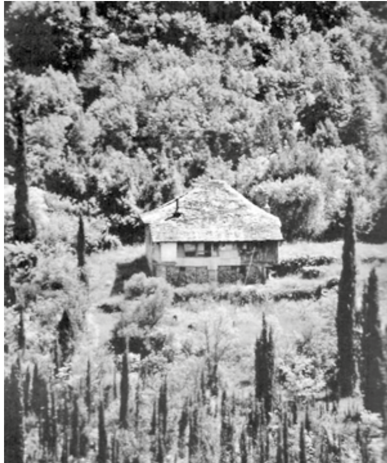
Η Παναγούδα. Το κελί όπου ο Παΐσιος έμενε από το 1979 έως το 1994.

χισα να χτυπάω την πόρτα. Καμιά απάντηση. Φώναξα λίγο, τίποτα. Έκανα μια βόλτα γύρω από το σπιτάκι και στο παράθυρο διέκρινα τη μορφή του. Ήρθε και μου άνοιξε. Μέσα βρισκόταν κι ένας γιατρός. Εξαιρετικός άνθρωπος. Κάθησα σ' έναν κορμό που είχε για καρέκλα. Σε λίγο ο γιατρός έφυγε και μείναμε μόνοι. Ένωσα κοντά του τόσο όμορφα. Ήταν πολύ λεπτός, θα έλεγα σκελετωμένος. Το ύψος του περίπου 1,60. Το βλέμμα του όλο ζωντάνια. Τα μάτια του εκφραστικά και διεισδυτικά, σπινθηροβόλα. Πράγματι, διαπίστωσα αυτό που έλεγαν πολλοί: «εκφραζόταν και μιλούσε με τα μάτια του». Τα γένια του μέτρια, πυκνά, μόλις είχαν αρχίσει να ασπρίζουν. (Αργότερα έγιναν κατάλευκα). Το ίδιο και τα μαλλιά του, ήταν πολύ πυκνά κι έφταναν