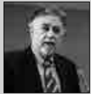
Του Γιάννη Πανούση καθηγητή Εγκληματολογίας στο Πανεπιστήμιο Αθηνών

Ότι και όποιος κινείται στην Κεντροαριστερά, τη Ριζοσπαστική ή και την Κομμουνιστική αριστερά είναι καλό γιατί το βάλτωμα προκαλεί συνήθως ιδεολογική υπνηλία, κοινωνική αδιαφορία και πολιτική αδράνεια. Κινητικότητα λοιπόν αλλά με στόχο που υπερβαίνει την αυτοανάληψη, τον επικοινωνισμό και τους τακτικισμούς.