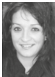
Τούντα, Διαιτολόγος, Διατροφολόγος, www.tountadiet.gr

Οι επιθυμητές τιμές: Στα μικρά παιδιά οι τιμές αναφοράς της αρτηριακής πίεσης είναι λιγότερο αυ-