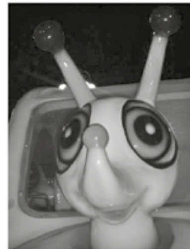
-Μαμά πες στον κυρ Βασίλη, άι σιχτίρ Καραγκιόζη!!!

Η συνάδελφος της φημιζόταν για την καταπληκτική της μνήμη. Θυμόταν την μισή Πελοπόννησο. Ολόκληρα γενεαλογικά δέντρα μπορούσε να σου διηγηθεί από μνήμης.