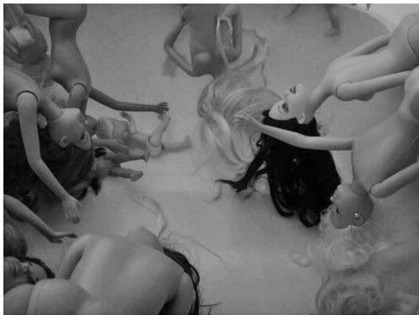
Μετέωρος γαλάζιος θρήνος...