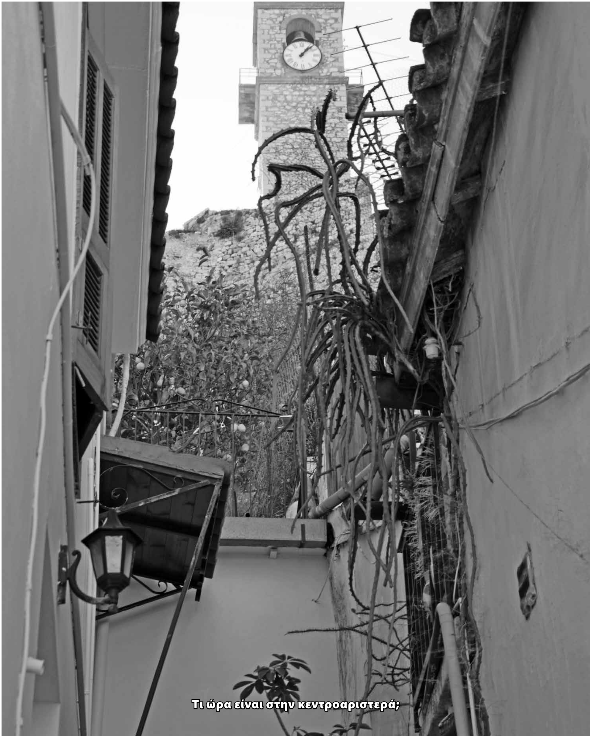
Τι ώρα είναι στην κεντροαριστερά;