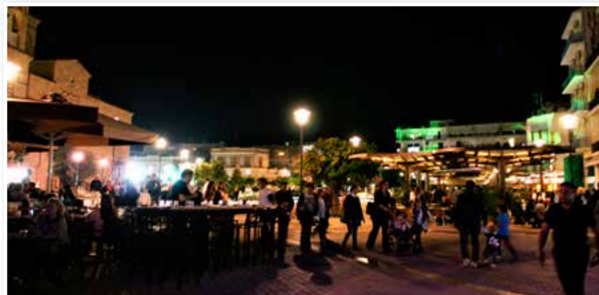
Ο αγώνας διεξήχθη σε κεντρικούς εμπορικούς δρόμους και μπρος από τα πιο σημαντικά πολιτιστικά μνημεία της πόλης του Άργους

Συμπέρασμα όπως και να έχει τη διοργάνωση του «ARGOS WHITE NIGHT RUN» μόνο θετική μπορούμε να την δούμε.