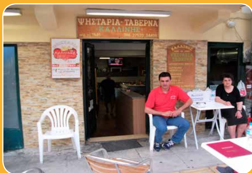
ΚΑΛΛΙΝΗΣ ΨΗΣΤΑΡΙΑ. Καθημερινά εκτός Κυριακής στην Πρόνοια του Ναυπλίου θα βρείτε υπέροχο σουβλάκι, κοτόπουλο στη σχάρα και ό,τι άλλο τραβάει η όρεξή σας. Η ταβέρνα είναι από τις παλαιότερες του Ναυπλίου, αφού χρονολογείται από το 1946. Βρίσκεται στην οδό 25ης Μαρτίου 41, στο Ναύπλιο. Τηλ.: 27520 24408

Ο «Αναγνώστης Πελοποννήσου» στηρίζει και προβάλλει την τοπική αγορά, τις ντόπιες επιχειρήσεις, τους αξιόλογους επαγγελματίες, που κέρδισαν την εμπιστοσύνη μας... Μαζί προσπερνάμε την κρίση και επιχειρούμε μέσα από αυτή τη σελίδα να παρουσιάσουμε