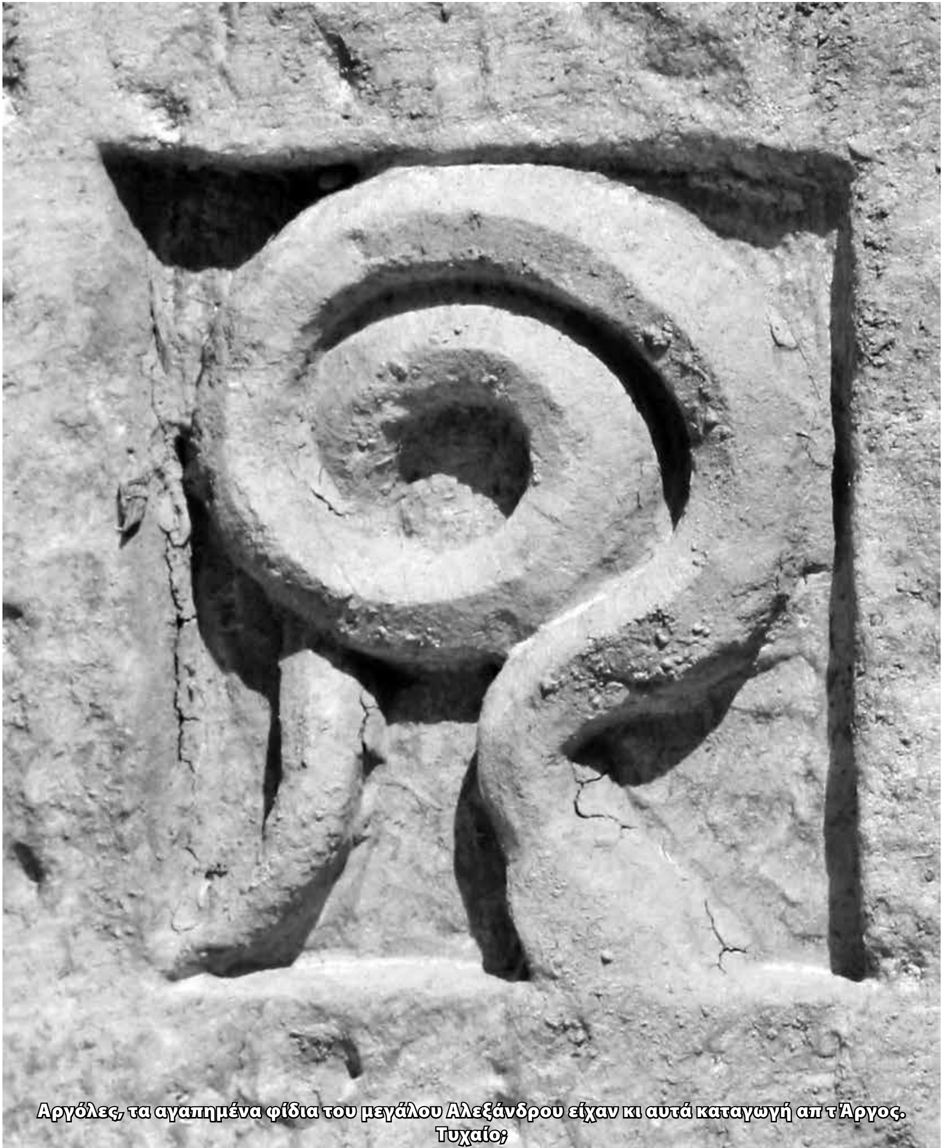
Αργόλες, τα αγαπημένα φίδια του μεγάλου Αλεξάνδρου είχαν κι αυτά καταγωγή απ τ'Αργος. Τυχαίο;