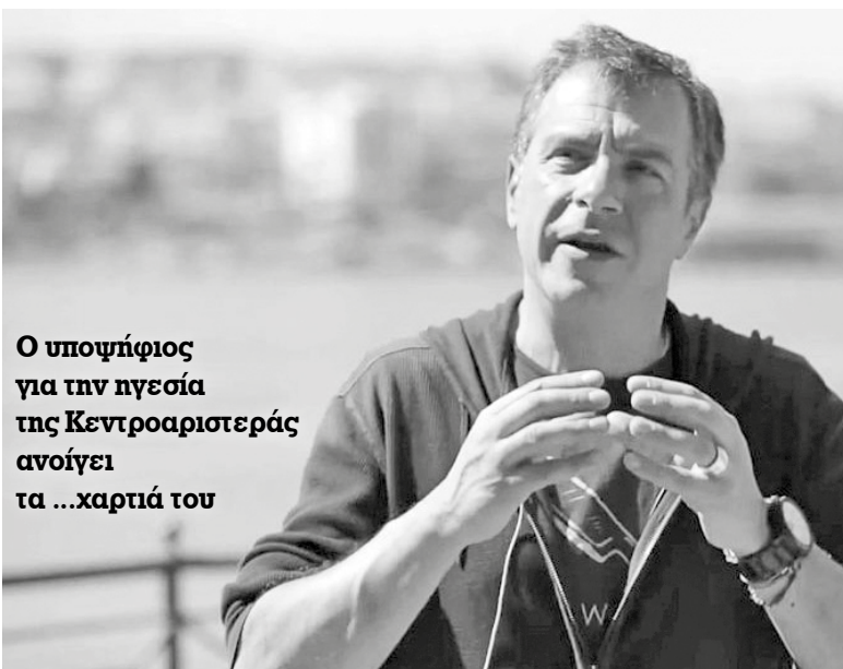
Ο υποψήφιος για την ηγεσία της Κεντροαριστεράς ανοίγει τα ...χαρτιά του

• Ποιες θα είναι όμως οι αρχές του; Πιο πολύ