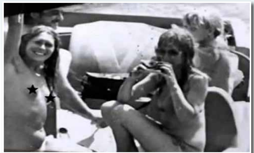
Η δημιουργία Γυμνιστικού Κέντρου ήταν κάτι που δεν ήταν έτοιμη να δεχθεί η τοπική κοινωνία