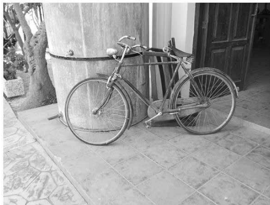
Τι να πούμε στα παιδιά;...

**Οι δυο ιστορίες είναι πραγματικές μου τις χάρισαν όπως και τόσες άλλες δυο μικροί μου «φίλοι».