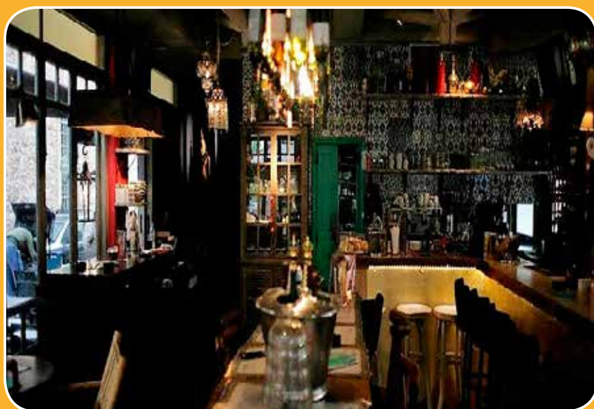
ΤΟ ΣΟΚΑΚΙ. Σημείο συνάντησης και αναφοράς στο Ναύπλιο. Στέκι από την δεκαετία του '80 είναι μια από τις παλιότερες καφετέριες στην πόλη, αναμνήσεις και εικόνες πολλών ετών σε μια γειτονιά που φαίνεται να το αγκαλιάζει και να το κάνει πιο ζεστό με κάθε επισκέπτη ή θαμώνα που περνάει το κατώφλι του. Βρίσκεται στην οδό Εθνικής Αντιστάσεως 8, στο Ναύπλιο. Τηλ.: 2752 026032