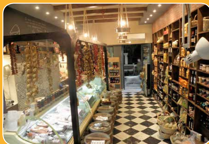
Τ'ΑΝΑΠΛΙΩΤΙΚΟ ΜΠΑΚΑΛΙΚΟ. Εξειδικευμένο παντοπωλείο, με στόχο την ανάκτηση γευστικών αναμνήσεων. Θα βρείτε ό,τι καλύτερο παράγει ο ευλογημένος μας τόπος. Βρίσκεται στην οδό Πλαπούτα 29, στο Ναύπλιο. Τηλ.: 2752 026764

Ο «Αναγνώστης Πελοποννήσου» στηρίζει και προβάλλει την τοπική αγορά, τις ντόπιες επιχειρήσεις, τους αξιόλογους επαγγελματίες, που κέρδισαν την εμπιστοσύνη μας... Μαζί προσπερνάμε την κρίση και επιχειρούμε μέσα από αυτή τη σελίδα να παρουσιάσουμε