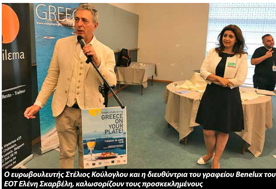
Ο ευρωβουλευτής Στέλιος Κούλογλου και η διευθύντρια του γραφείου Benelux του ΕΟΤ Ελένη Σκαρβέλη, καλωσορίζουν τους προσκεκλημένους

χώς αντιμετωπίζουμε. Το θέμα είναι ότι και πάλι με τις συνεργασίες, λύνουμε αυτά τα προβλήματα. Το μεγάλο πρόβλημα εδώ δεν είναι για παράδειγμα πώς θα βρούμε τη φάβα. Είναι να βρούμε τί θα συνοδεύσει τη φάβα. Μια καινούργια μαρμελάδα φραγκόσυκο για παράδειγμα, ένα ωραίο λουκάνικο. Αυτά είναι πρόβλημα».