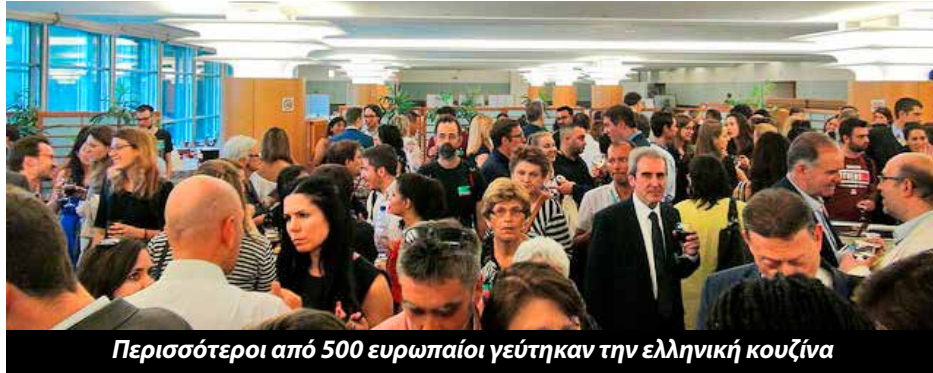
Περισσότεροι από 500 ευρωπαίοι γεύτηκαν την ελληνική κουζίνα