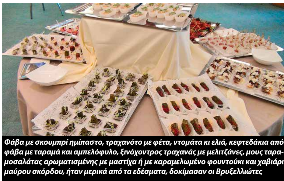
Φάβα με σκουμπρί ημίπαστο, τραχανότο με φέτα, ντομάτα κι ελιά, κεφτεδάκια από φάβα με ταραμά και αμπελόφυλο, ξινόχοντρος τραχανάς με μελιτζάνες, μους ταραμοσαλάτας αρωματισμένης με μαστίχα ή με καραμελωμένο φουντούκι και χαβιάρι μαύρου σκόρδου, ήταν μερικά από τα εδέσματα, δοκίμασαν οι Βρυξελλιώτες