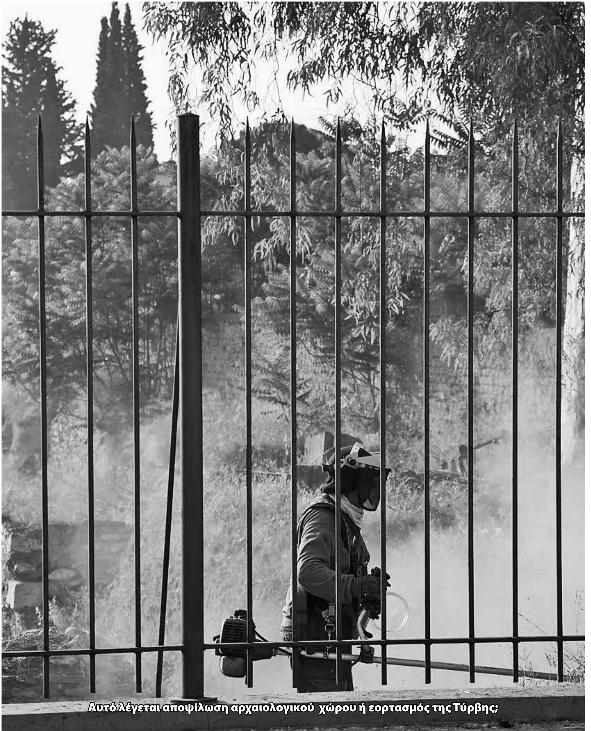
Αυτό λέγεται αποψίλωση αρχαιολογικού χώρου ή εορτασμός της Τύρβης;