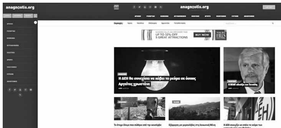
Πλοηγηθείτε τώρα στο νέο anagnostis.org

Στο ανανεωμένο anagnostis.org η ενημέρωση είναι συνεχής όλο το 24ωρο, με εύκολη κατηγοριοποίηση, ώστε να μπο-