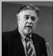
Του Πάνου Πανούση, καθηγητή Εγκληματολογίας στο Πανεπιστήμιο Αθηνών

Η δύσκολη οικονομική συγκυρία έχει θολώσει την κρίση των πολιτών αλλά και τη νηφάλια σκέψη των πολιτικών. Χωρίς ιδεολογικές σταθερές τα πόνια χοροπηδάνε στη σκακιέρα. Θα επιχειρήσω να προσεγγίσω ορισμένες πτυχές του πολιτικού μετέωρου βήματος από τη σκοπιά της Σοσιαλιστικής Δημοκρατικής Αριστεράς, του καταλύτη ανάμεσα στο μετανοιωμένο/ανανεωμένο ΠΑΣΟΚ και στον προσγειωμένο/μη-αυταπατώμενο (ελπίζω μετ-αλλαγμένο) ΣΥΡΙΖΑ. Κοινός παρονομαστής: αριστερά κόμματα, που καταστατικά εκφράζουν τους μη-έχοντες και κατέχοντες [μαύρο]