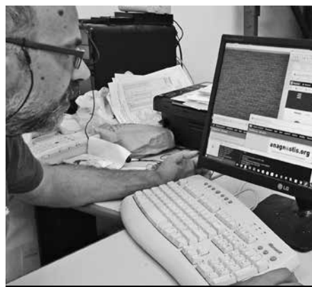
Το ανανεωμένο site στήθηκε με όλη τη σύγχρονη τεχνολογία από τον Φάνη Τσίρο και είναι ήδη στον αέρα

Με πολυποικίλη προβολή στα κοινωνικά δίκτυα facebook, twitter, Instagram, με δικό του κανάλι στο youtube, και με ροή rss το ανανεωμένο site θα σας καθηλώσει.