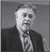
Του Γιάννη Πανούση, καθηγητή Εγκληματολογίας στο Πανεπιστήμιο Αθηνών

Η συνείδηση αλλάζει. Δεν μπαλώνεται Κ. Καλαπανίδας, Βομβύκιο