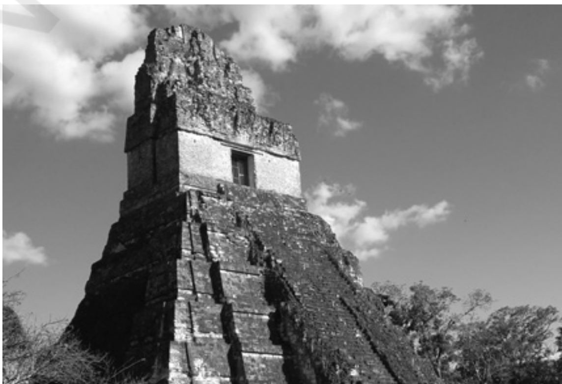
Αρχαιολογικός χώρος του Τικάλ στη Βόρεια Γουατεμάλα