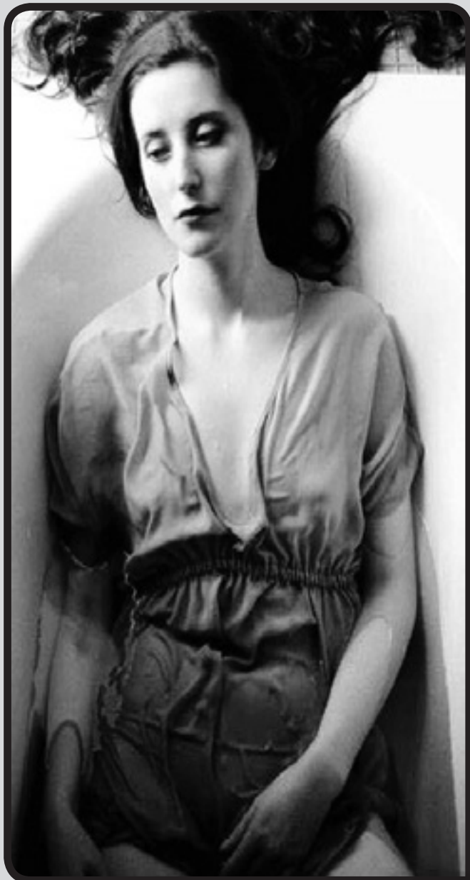
Γλυκιά, η μελαγχολία της Άνοιξης