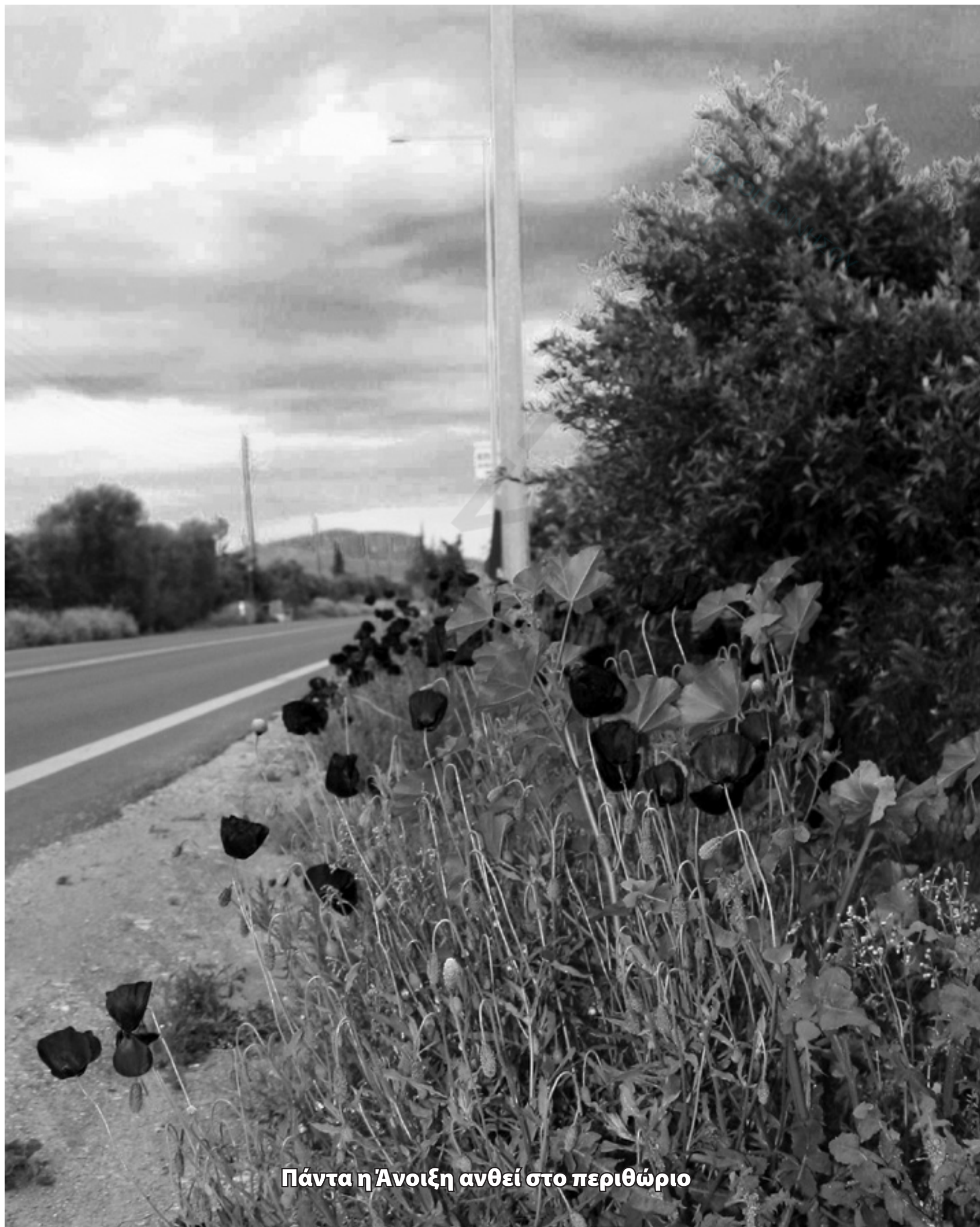
Πάντα η Άνοιξη ανθεί στο περιθώριο