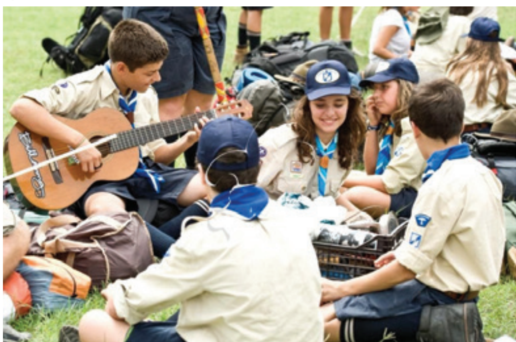
4ο Πανελλήνιο Τζάμπορ Ενωστές προσκόπων στο 4ο Πανελλήνιο Τζάμπορ στα Κομμένα Βούρλα το 2010.