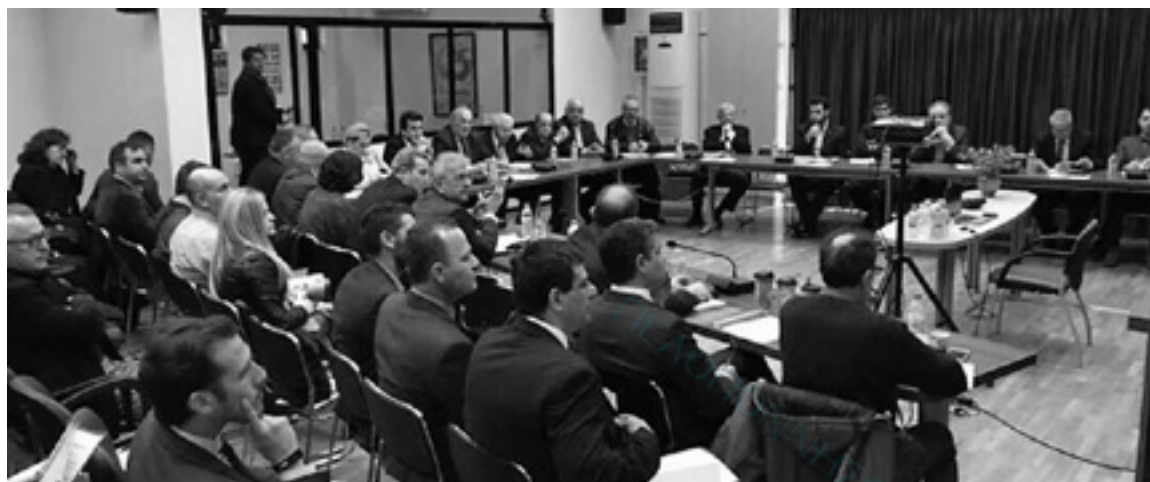
Ο Σφυρής αναζητεί τρόπους χρηματοδότησης από Ευρωπαϊκά Προγράμματα