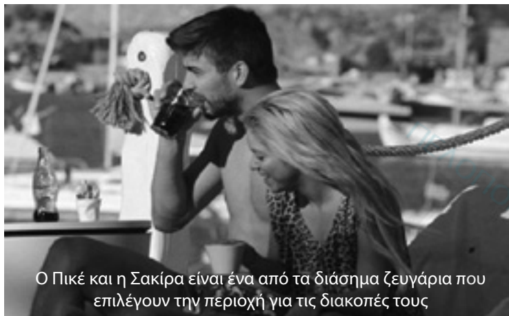
Ο Πικέ και η Σακίρα είναι ένα από τα διάσημα ζευγάρια που επιλέγουν την περιοχή για τις διακοπές τους

Οι luxurians ή τουρίστες πολυτελείας, δεν επιθυμούν πλέον να αγοράζουν σουβενίρ ή αντικείμενα. Τους ενδιαφέρει η αναψυχή, η αποφόρτιση, η ξεχωριστή εμπειρία. Το νέο trend είναι η απλότητα. Οι τουρίστες πολυτελείας δεν είναι αδιάφοροι προς τα εργαλεία της ψηφιακής τεχνολογίας και τα μέσα κοινωνικής δικτύωσης. Το αγαπημένο τους μέσο είναι το instagram και αναζητούν apps που θα τους διευκολύνουν στις περιηγήσεις