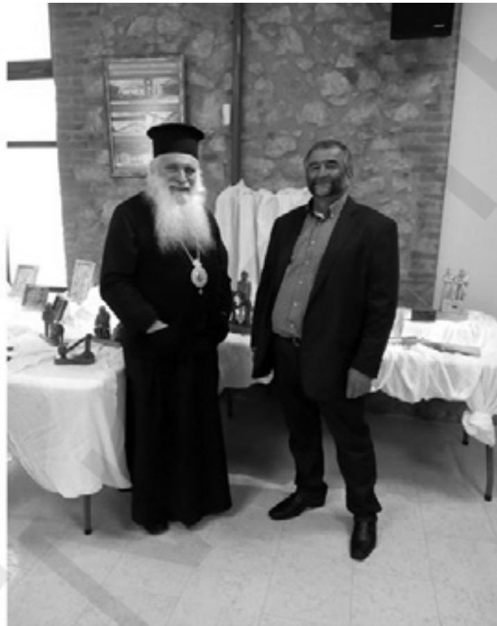
Σμιλεύοντας την Κοινότητα ...Ξυλογλυπτική της Ρωμοσύνης

-Ο παππούς ξεδιψά με σεβασμό τον μακροχρόνιο βοηθό του, ο γαϊδαράκος πριν από λίγο έφτασε στο χωριό μετά από ώρες πορείας, Σαββάτο είχαν κατέβει να πουλήσουν και να