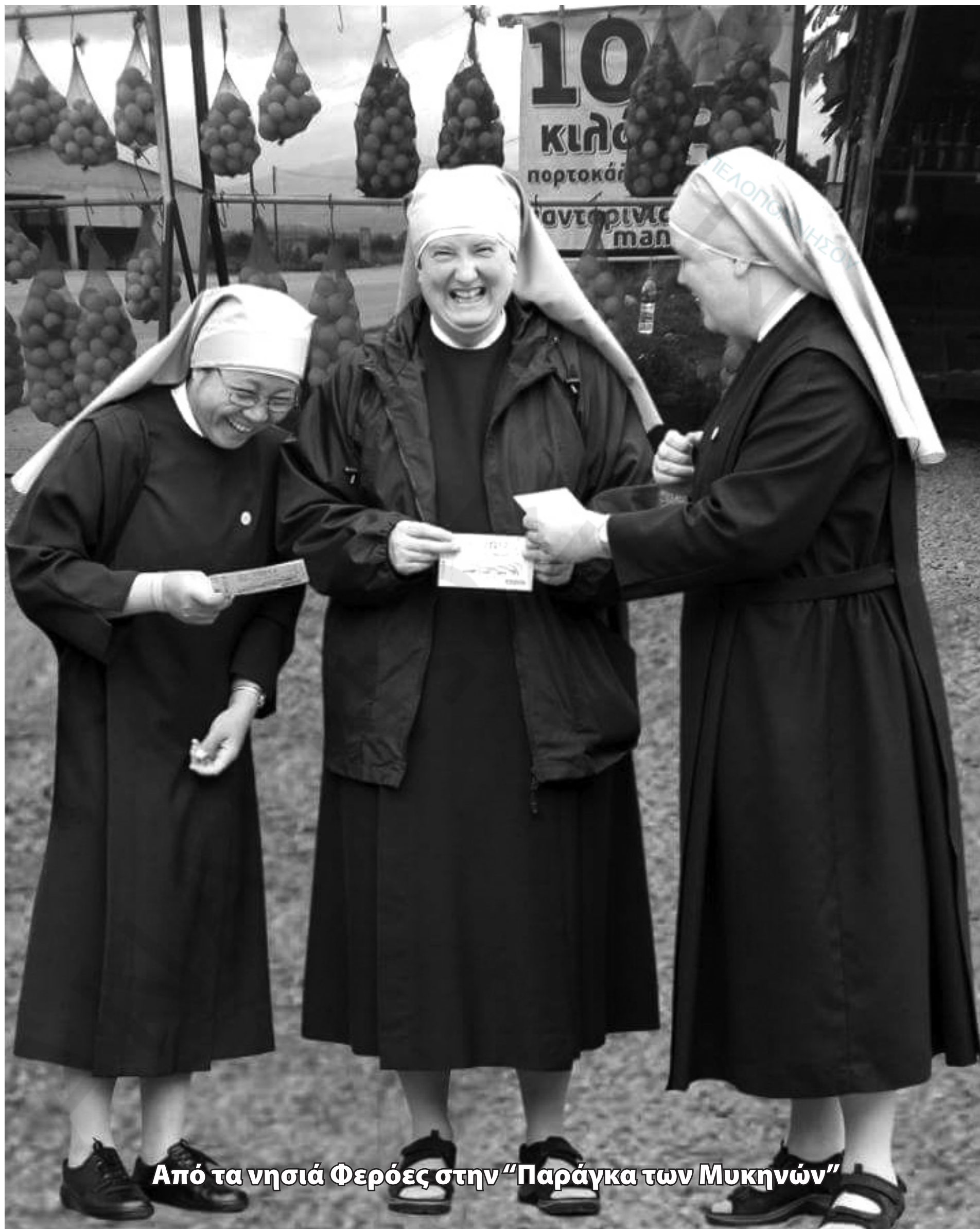
Από τα νησιά Φερόες στην "Παράγκα των Μυκηνών"