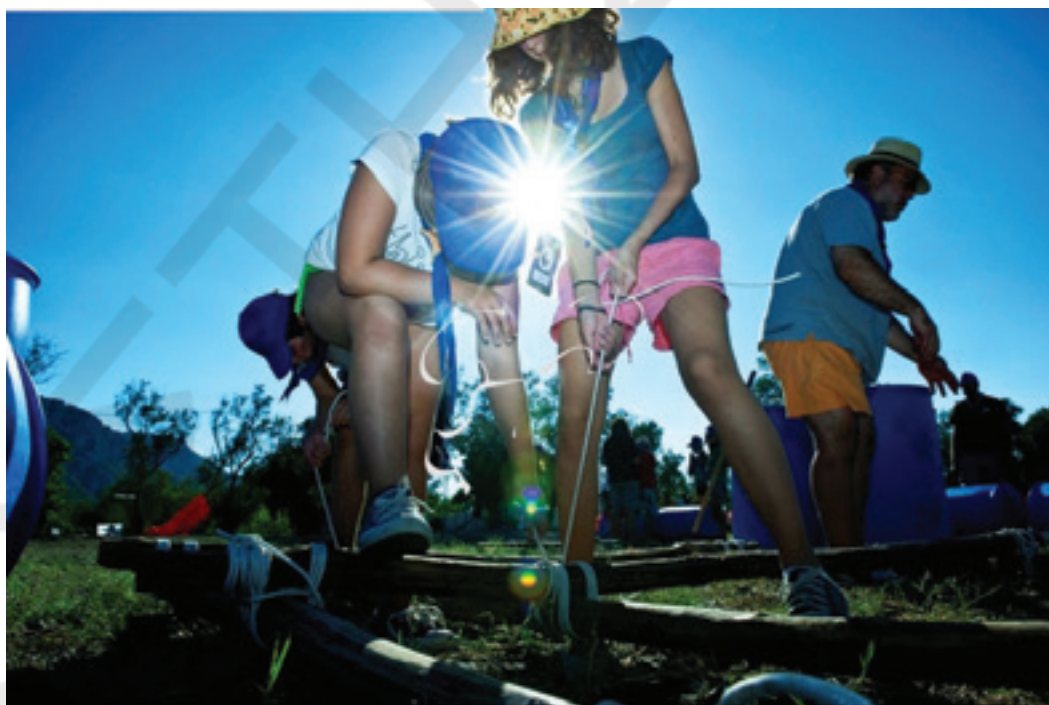
4ο Πανελλήνιο Τζάμπορ Ενωστές προσκόπων δημιουργεί τις κατασκευές της γνώσης της στο 4ο Πανελλήνιο Τζάμπορ στα Κομμένα Βούρλα το 2010.