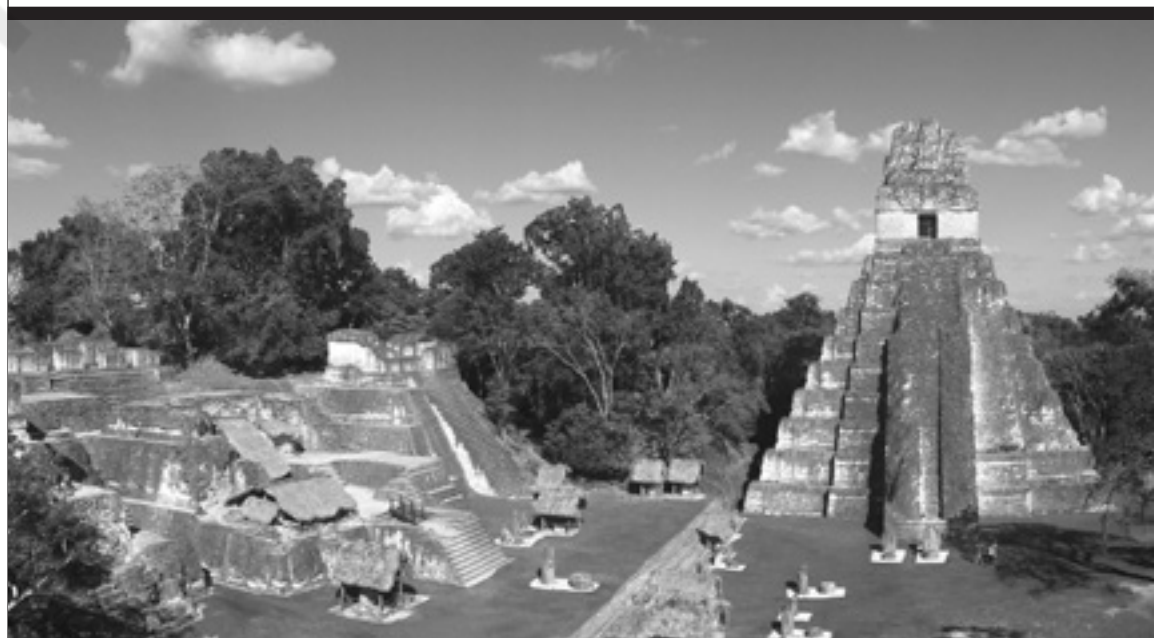
Αρχαιολογικός χώρος του Τικάλ στη Βόρεια Γουατεμάλα