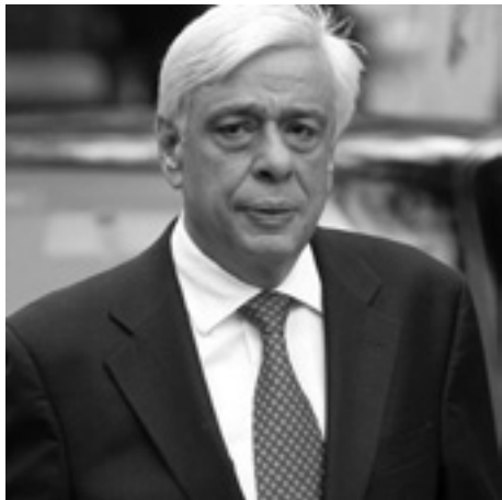
Του Προκόπου Παυλόπουλου*

Διδάσκομαι κατά την άσκηση των καθηκόντων μου από τη λαμπρή ιστορία του Δήμου Ερμιονίδας, ιστορία αρρήκτως συνδεδεμένη με την πορεία του αγώνα της Εθνεγερσίας του 1821 και, κυρίως, με την συνταγματική θωράκιση του υπό διαμόρφωση Ελληνικού Κράτους. Την αλήθεια της διαπίστωσης αυτής τεκμηριώνει, αμαχίτως, το γεγονός ότι ο σημερινός εορτασμός είναι αφιερωμένος στην 190η Επέτειο της Γ' Εθνοσυνέλευσης του 1827.