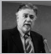
Του Πάνου Πανούση, καθηγητή Εγκληματολογίας στο Πανεπιστήμιο Αθηνών

Ούνα φάτσα, ούνα ράτσα Κορίνθιοι και Αργεΐτες