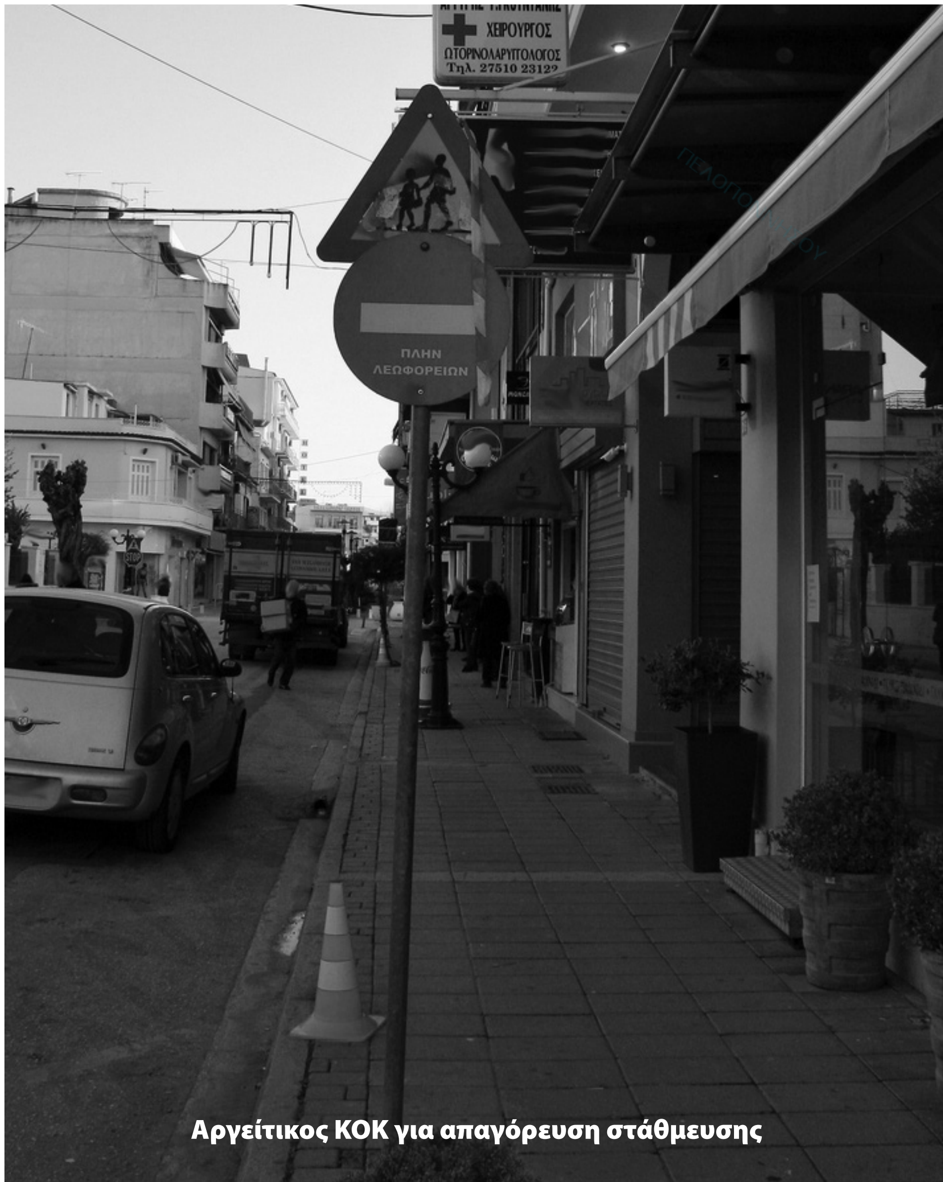
Αργεϊτικός ΚΟΚ για απαγόρευση στάθμευσης