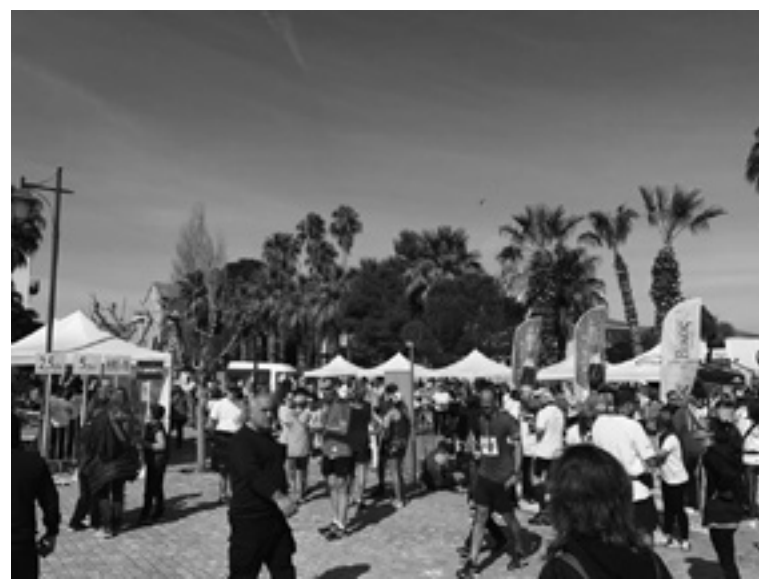
το Ναύπλιο τις μέρες του Μαραθωνίου 2017.

Η συμμετοχή 1565 μαθητών συνολικά και στα δύο αγωνίσματα αποτελεί το μεγαλύτερο «κέρδος» για την διοργάνωση, μεγαλύτερο από την δημοσιότητα και την κοσμοπλημμύρα που έζησε