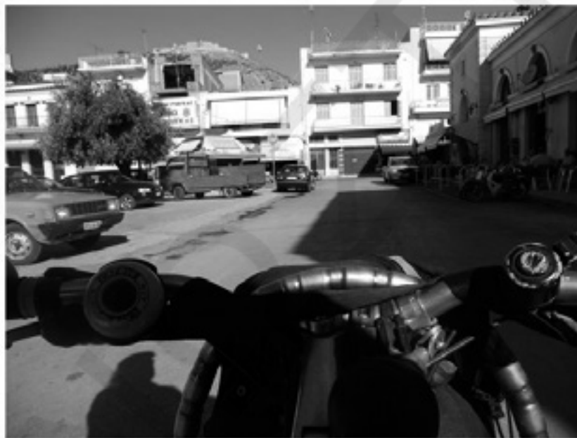
ΤΑ ΕΝΟΙΚΙΑ, ΚΕΡΑΣΜΑΤΑ ΤΗΣ ΣΥΝΤΑΞΗΣ...

-Σπυράκο, να πάρε να κάνεις τα κουμάντα σου(και τον δίνει ο κυρ Τάκης το φάκελο με τα τιμολόγια του προηγούμενου μήνα) και την γκρινιέρα (έτσι έλεγε την ταμειακή μηχανή γιατί με το μεταλλικό βρυχηθμό της συνεχώς γκρινιάζε για έσοδα) όποτε νομίζεις έλα να την πάρεις.