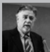
Του Γάβνη Πανούση, καθηγητή Εγκληματολογίας στο Πανεπιστήμιο Αθηνών

Από τους έντιμους και ανιδιοτελείς, κανέναν.