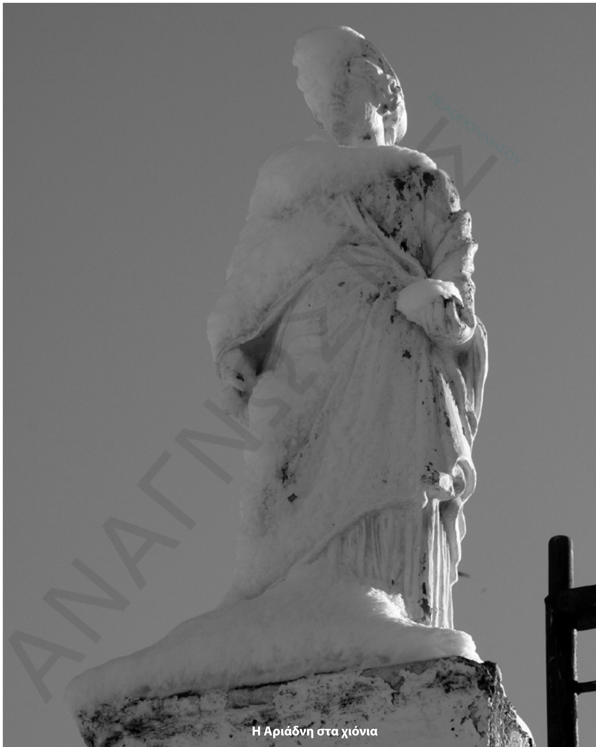
Η Αριάδνη στα χιόνια