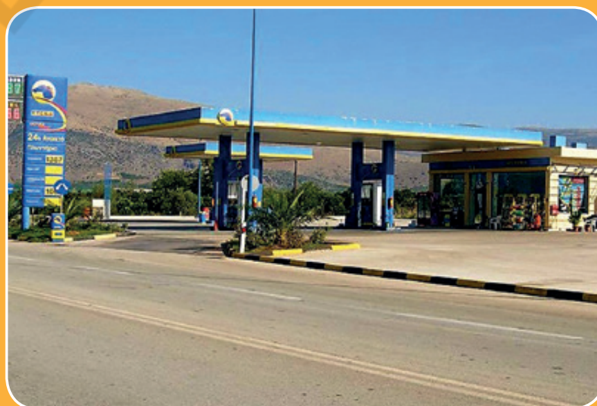
ΠΡΑΤΗΡΙΟ ΚΑΥΣΙΜΩΝ ΕΤΕΚΑ. ΟΜΙΛΟΣ ΕΠΙΧΕΙΡΗΣΕΩΝ Α.ΑΠΟΣΤΟΛΟΥ. 24ώρες υγρά καύσιμα, diesel marine, πλυντήριο οχημάτων, parking, mini market, αξεσουάρ αυτοκινήτων. Βρίσκεται στην Μιδέα. Τηλ.: 2752 770000, 698 725 3587

Ο «Αναγνώστης Πελοποννήσου» στηρίζει και προβάλλει την τοπική αγορά, τις ντόπιες επιχειρήσεις, τους αξιόλογους επαγγελματίες, που κέρδισαν την εμπιστοσύνη μας... Μαζί προσπερνάμε την κρίση και επιχειρούμε μέσα από αυτή τη σελίδα να παρουσιάσουμε