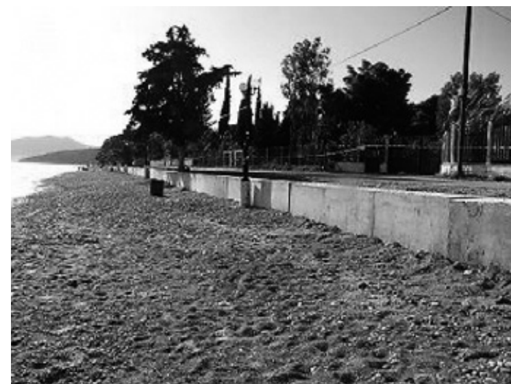
Οι παρεμβάσεις στην Πλάκα θα λύσουν το πρόβλημα;

Για την ακτή των Ιρίων προτείνεται η κατασκευή τεσσάρων βυθισμένων κυματοθραυστών μήκους 100 μ. έκαστος και σε απόσταση 70 μ. μεταξύ τους, καθώς και η επαναπλήρωση της ακτής με αμμώδες υλικό σε μήκος 600 μ. περίπου και σε πλάτος περίπου 16 μ. Η Μελέτη θα είναι συνολικού ύψους 55.350,00 € μαζί με τον ΦΠΑ και η καταβολή του ποσού αυτού θα γίνει σε δύο στάδια».