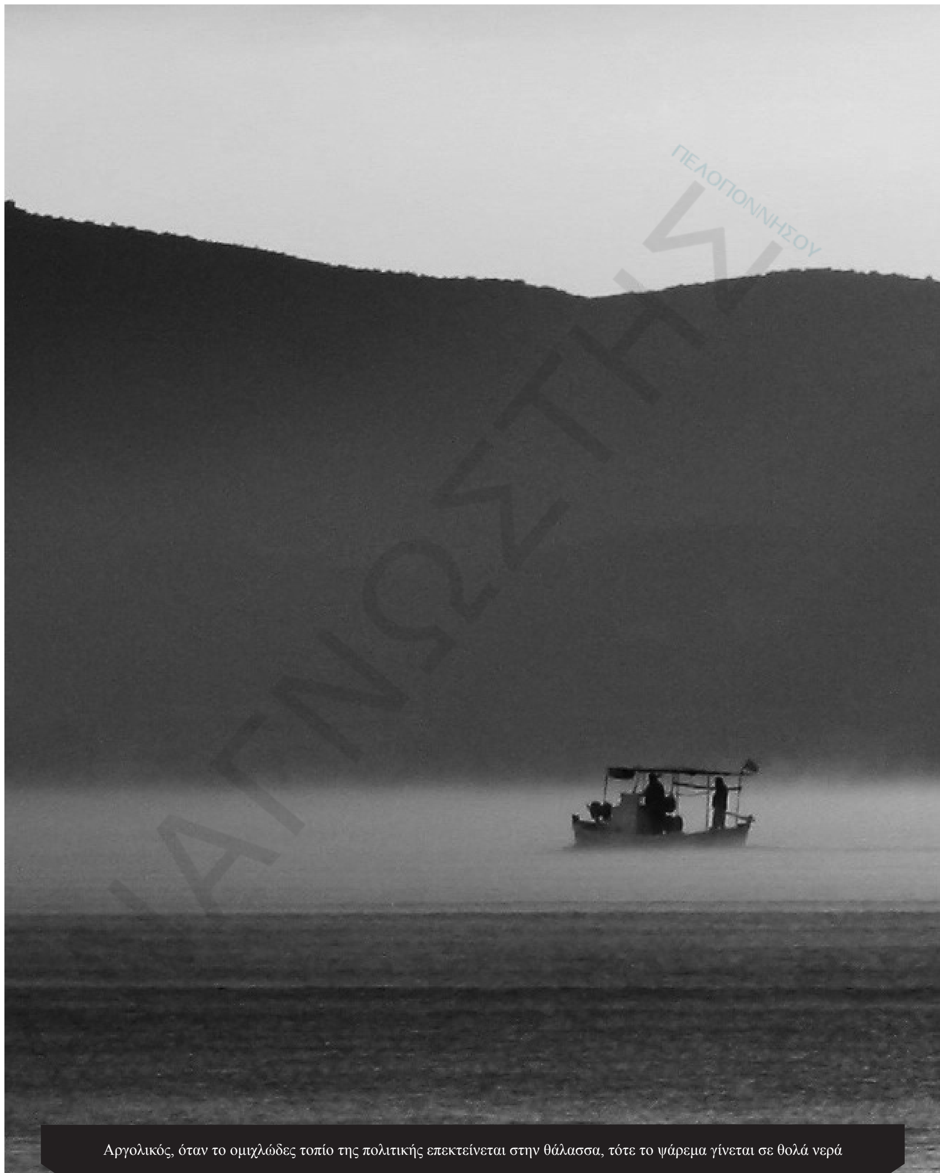
Αργολικός, όταν το ομιχλώδες τοπίο της πολιτικής επεκτείνεται στην θάλασσα, τότε το ψάρεμα γίνεται σε θολά νερά