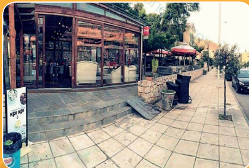
VILLA CAFE. Όλο το 24ωρο απολαμβάνετε τον καφέ σας, σφολιάτες, μπακέτες, παγωτό, γλυκό, ποτό. Συντροφιά και στα ποδόσφαιρα με ΟΤΕ SPORT κ' CONN X TV. Βρίσκεται στην οδό Ασκληπιού 50, στο Ναύπλιο. Τηλ.: 2752 096054