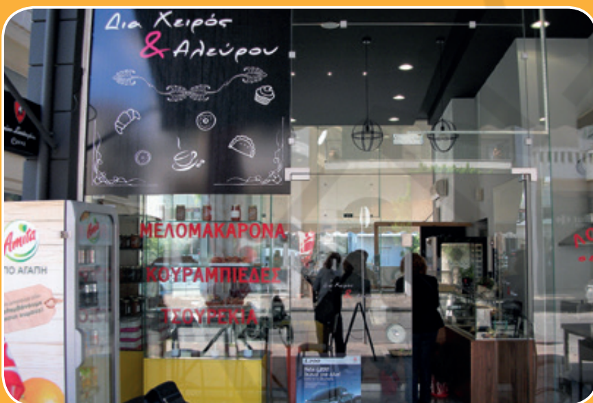
ΔΙΑ ΧΕΙΡΟΣ & ΑΛΕΥΡΟΥ. Χειροποίητα προϊόντα, αρτοσκευάσματα, σφολιατοειδή, σάντουιτς, καφές. Το κατάστημα βρίσκεται στην οδό Άργους 31-33 & Αιγίου, στο Ναύπλιο. Τηλ.: 27520 97709