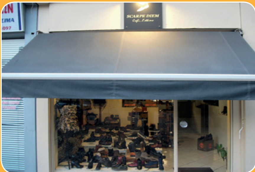
SCARPE DIEM - Κατάστημα δερμάτινων ανδρικών και γυναικείων υποδημάτων. Το κατάστημα βρίσκεται στην οδό Νικητάρá 3, στο Άργος. Τηλ.: 2751 024333