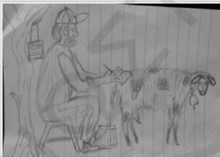
ΟΤΑΝ ΔΕΝ ΑΡΜΕΓΩ ΓΡΑΦΩ (ΣΚΙΤΣΤΟ ΤΟΥ ΧΑΡΙΛΑΟΥ ΡΕΜΠΕΛΟΥ)

-Μη τα ισοπεδώσουμε ούλα Μπάρμπα- Μήτρο του λέω. Αυτοί που τα δίνουν ξέρουν πάρα - πάρα - πάρα από 'μας. Σπουδαγμένοι άνθρωποι είναι.