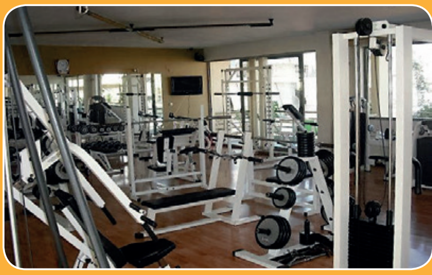
ΓΥΜΝΑΣΤΗΡΙΟ SUMMIT. Διαθέτει πλήρως εξοπλισμένα όργανα γυμναστικής με άριστα εκπαιδευμένους προπονητές που θα οργανώσουν το προσωπικό σας ασκησιολόγιο και θα σας βοηθήσουν να πετύχετε τους στόχους σας. Βρίσκεται στην οδό Τσολακοπούλου 1, στο Ναύπλιο. Τηλ: 2752 029072