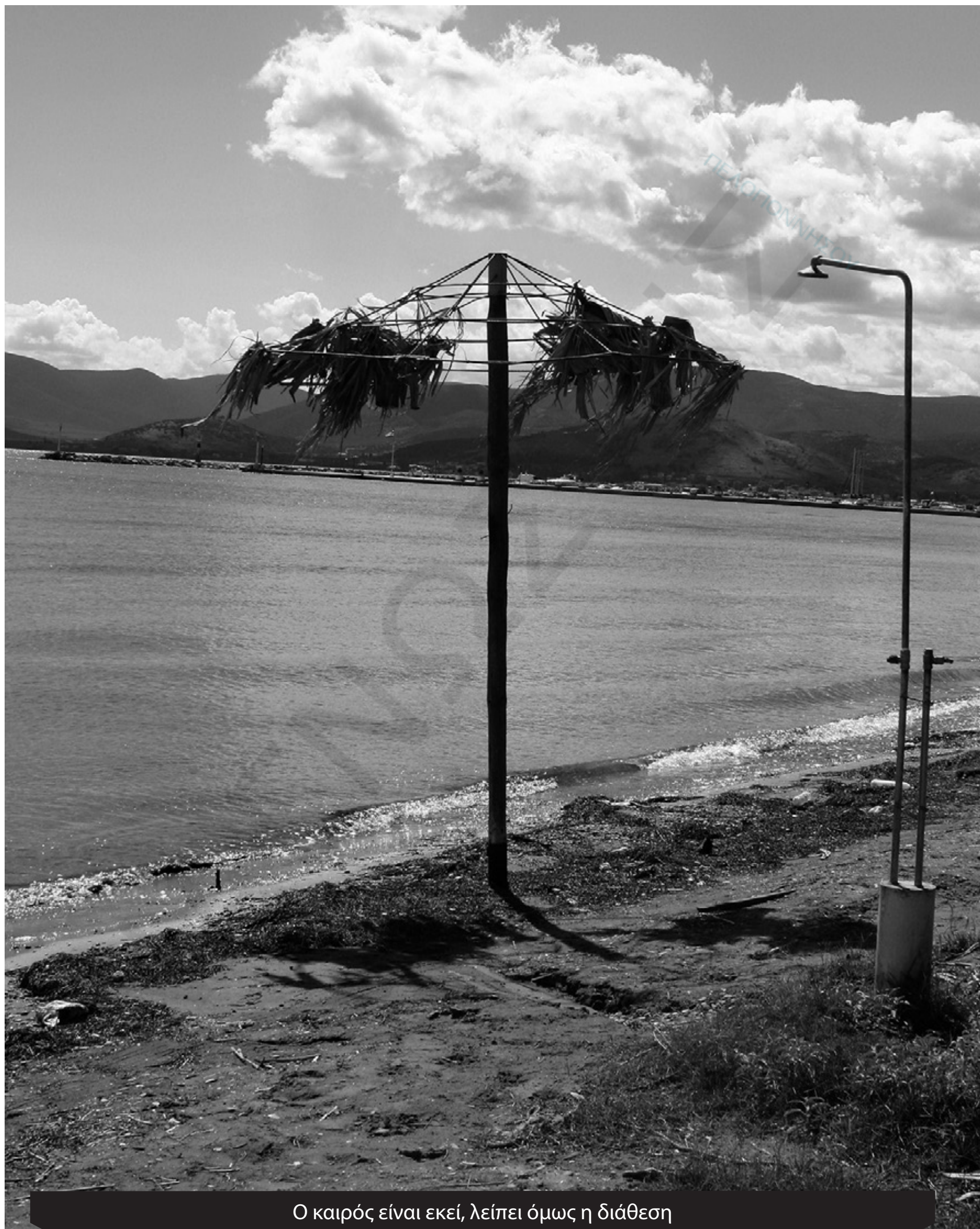
Ο καιρός είναι εκεί, λείπει όμως η διάθεση