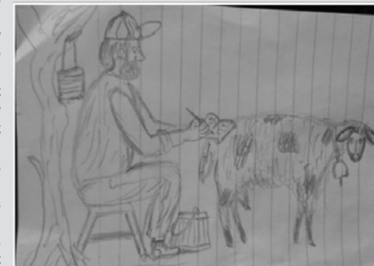
ΟΤΑΝ ΔΕΝ ΑΡΜΕΓΩ ΓΡΑΦΩ (ΣΚΙΤΣΟ ΤΟΥ ΧΑΡΙΛΑΟΥ ΡΕΜΠΕΛΟΥ)

-Νάτου το συχαμένο, μου λέει και μου δίνει ένα κουνούπ' στην μέση της σελίδας.