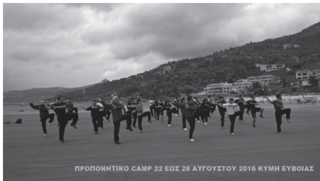
ΠΡΟΠΟΝΗΤΙΚΟ CAMP 22 ΕΩΣ 28 ΑΥΓΟΥΣΤΟΥ 2016 ΚΥΜΗ ΕΥΒΟΙΑΣ