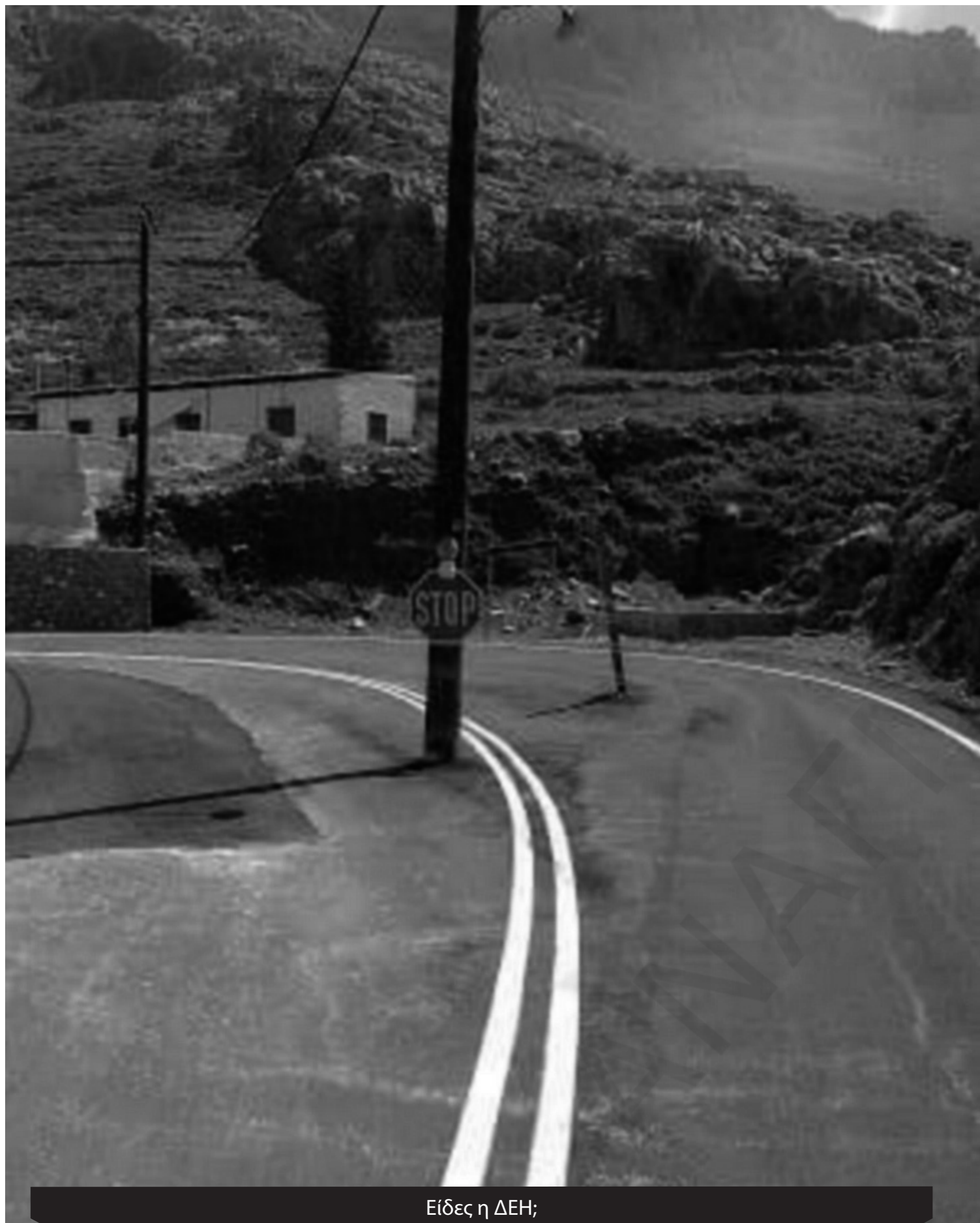
Είδες η ΔΕΗ;

Πληρώνουμε ακριβά την στενοκεφαλιά της τοπικής αυτοδιοίκησης