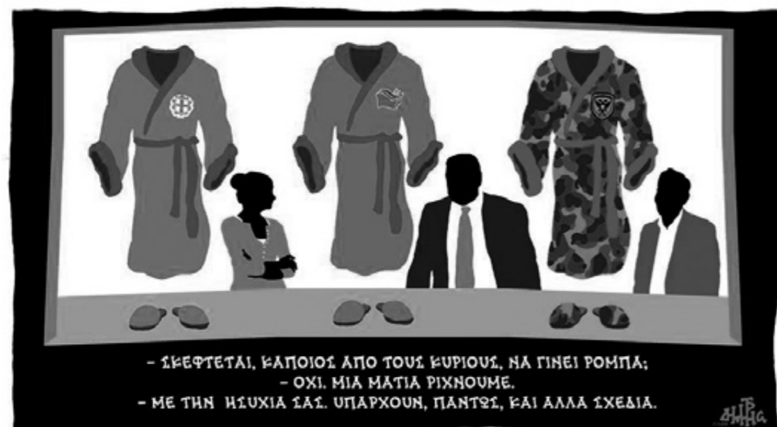
Σκίτσο του Δημήτρη Χαντζόπουλου από την "Καθημερινή"

Και μετά απ' όλ' αυτά, αναρωτήστε για ποιο λόγο υπο-