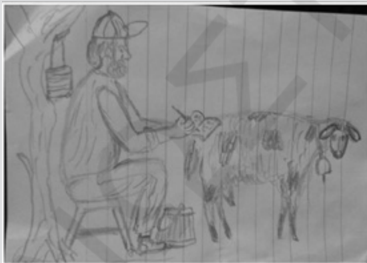
ΟΤΑΝ ΔΕΝ ΑΡΜΕΓΩ ΓΡΑΦΩ (ΣΚΙΤΣΟ ΤΟΥ ΧΑΡΙΛΑΟΥ ΡΕΜΠΕΛΟΥ)