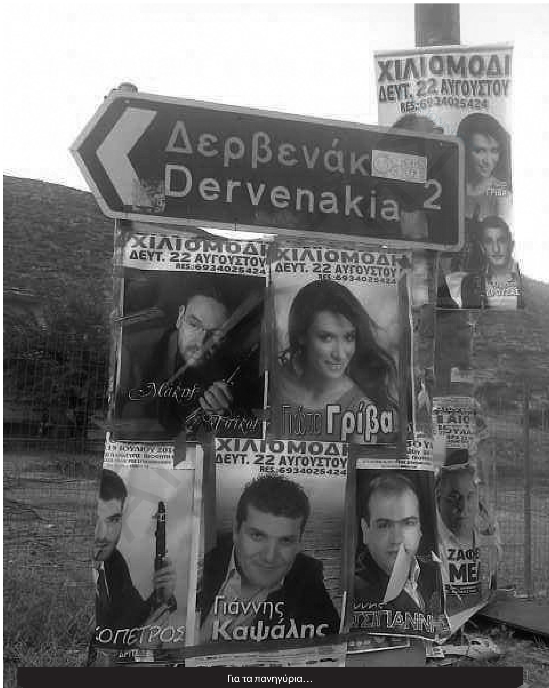
Για τα πανηγύρια...