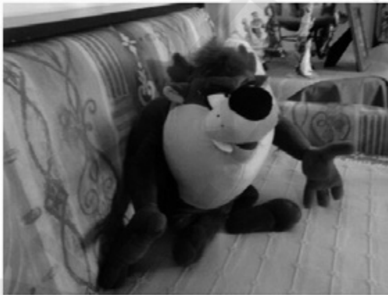
Παιγνιδάδικο ..... παιγνιδάδικο !!!

Ο δεμένος πλέον παραβάτης είδε την μαμά του να μπαίνει μέσα. Δεν του είπε το παραμικρό, ξεκίνησε προσεκτικά το αυτοκίνητο και πήρε κατεύθυνση τον περιφερειακό δρόμο.