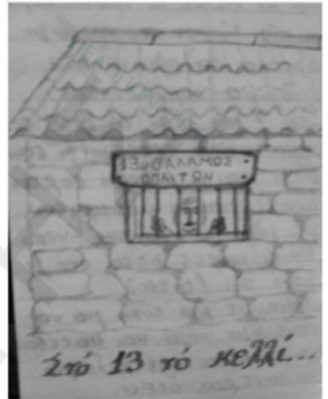
ΣΚΙΤΣΟ ΑΠΟ ΤΟ ΗΜΕΡΟΛΟΓΙΟ ΤΟΥ ΧΑΡΙΛΑΟΥ ΡΕΜΠΕΛΟΥ

Κάναμε 25 περίπου χιλιόμετρα. Το δρομολόγιο που ακολουθήσαμε είχε απότομες ανηφοριές που μας κόψανε τα