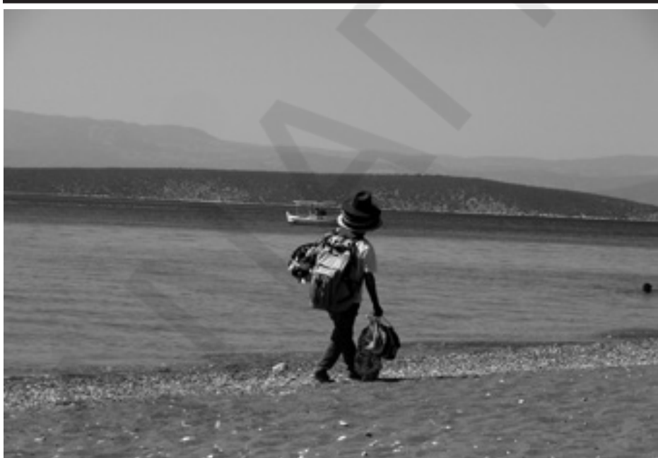
Αγώνας για την επιβίωση B.M.

αποφυγή του σχολικού εκφοβισμού, και περί του στιγματισμού των «θυμάτων». Με ποιόν τρόπο συμβάλλει το άμεσο περιβάλλον (οικογένεια), και αντιστοίχως το έμμεσο περιβάλλον (σχολείο). Κατακλείδα (παρουσίαση της κατάστασης και θετικό μήνυμα). Ερωτήσεις και σχόλια. Αξιολόγηση και έκφραση μέσω έντυπης μορφής, αναφορικά με την επιθυμία για συνέχιση ενημέρωσης μέσω ομιλιών, και για μελλοντική δημιουργία ομάδων γονέων.