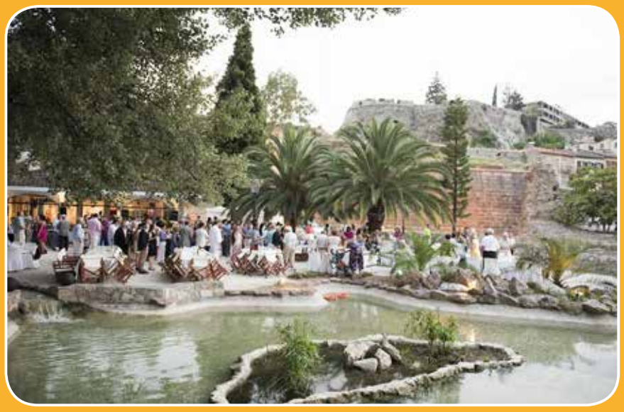
PROPOLIS. Παραδοσιακό Καφενείο, εστιατόριο. Θα απολαύσετε σε ένα υπέροχο χώρο, μεζέδες, σαλάτες εποχής, πιάτα της ώρας, φαγητά και γλυκά της γιαγιάς με τη φροντίδα της μαμάς... Το Propolis βρίσκεται στην πλατεία Σταϊκόπουλου, δίπλα στην Πύλη της Ξηράς, στο Ναύπλιο. Τηλ. 2752 306725