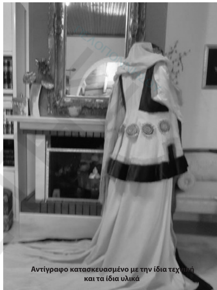
Αντίγραφο κατασκευασμένο με την ίδια τεχνική και τα ίδια υλικά

χρησογάιτανα ή ασημογάιτανα, σειρογάιτανα (μεταξωτά), ουτραδες (βαμβακερά) και τεχνίλια (μάλλινα). Ο χρυσοράπτης με τα επιραμμένα γαϊτάνια σχημάτιζε τα διακοσμητικά θέματα (συμπλέγματα από ρόδακες, δικέφαλους αετούς, πουλιά, ανθέ-