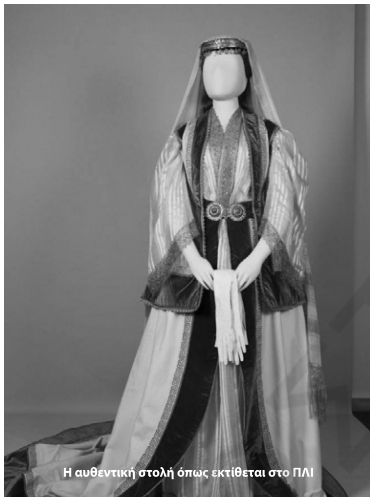
Η αυθεντική στολή όπως εκτίθεται στο ΠΛΙ

Οι ραφτάδες-τερζήδες, ή οι χρυσοράπτες ράβανε ή κεντούσανε όλες αυτές τις πλούσιες φορεσιές και τους επενδύτες τους. Η τέχνη του χρυσοράπτη περιελάμβανε ράψιμο, κέντημα (κάρφωμα) και σχηματισμό των διακοσμητικών σχεδίων με τα επιραμμένα στο ύφασμα (μεταξωτό, βελούδο, μάλλινο)