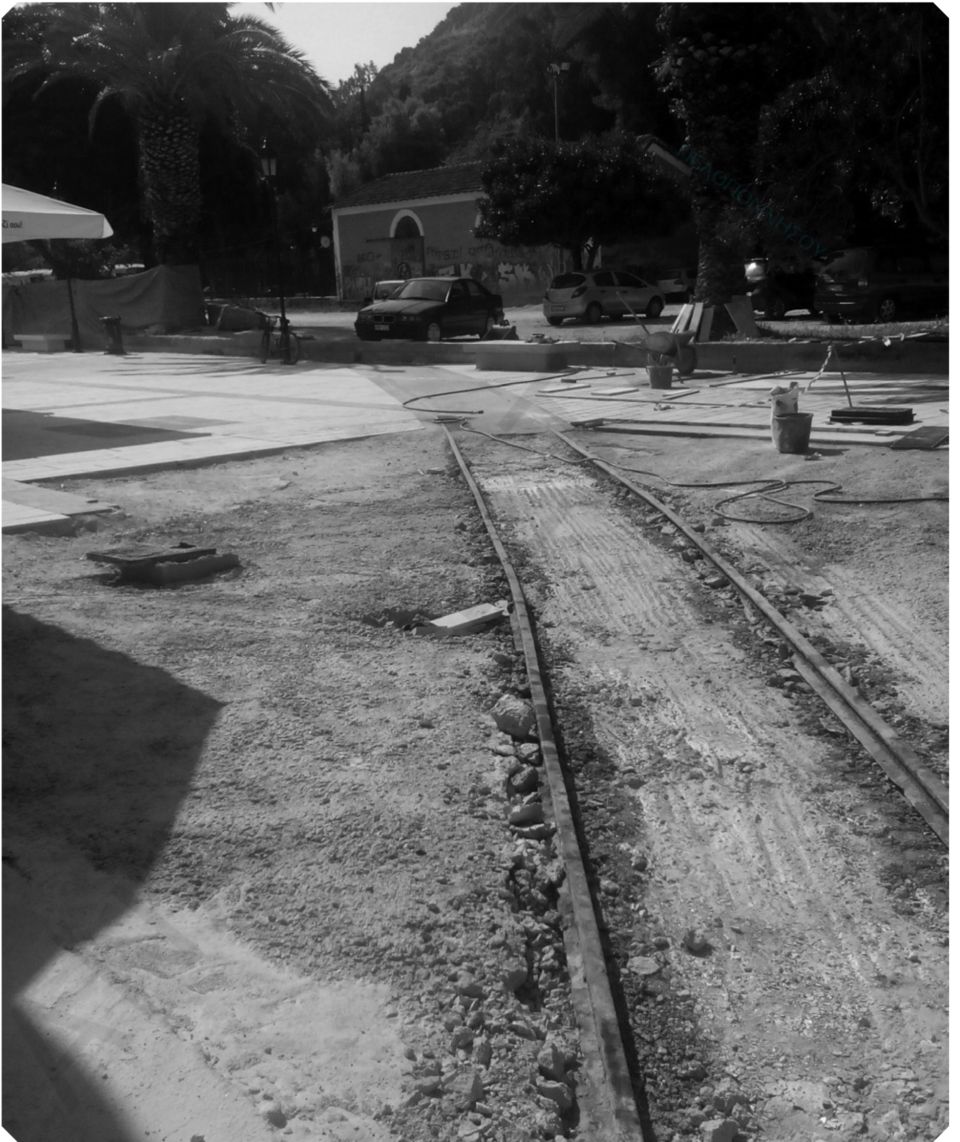
Αλήθεια, πόσο μπροστά βρισκόταν η Ελλάδα του Τρικούπη, όταν τα τρένα της έφταναν μέχρι το Λιμάνι. Σήμερα όχι μόνο πτωχέυσαμε αλλά χάσαμε και το τρένο