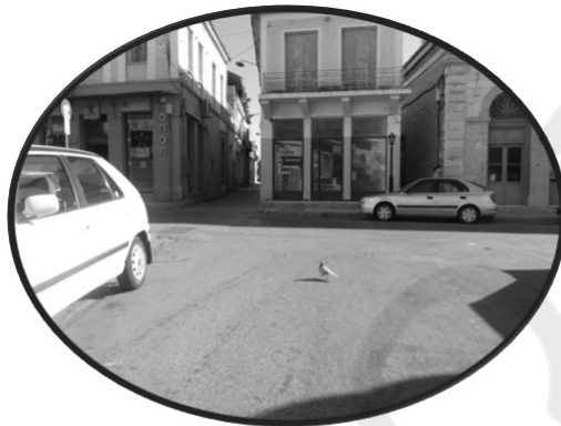
ΚΑΡΟΤΣΙ ΠΙΑΝΕΙΣ ΚΑΘΟΛΟΥ;