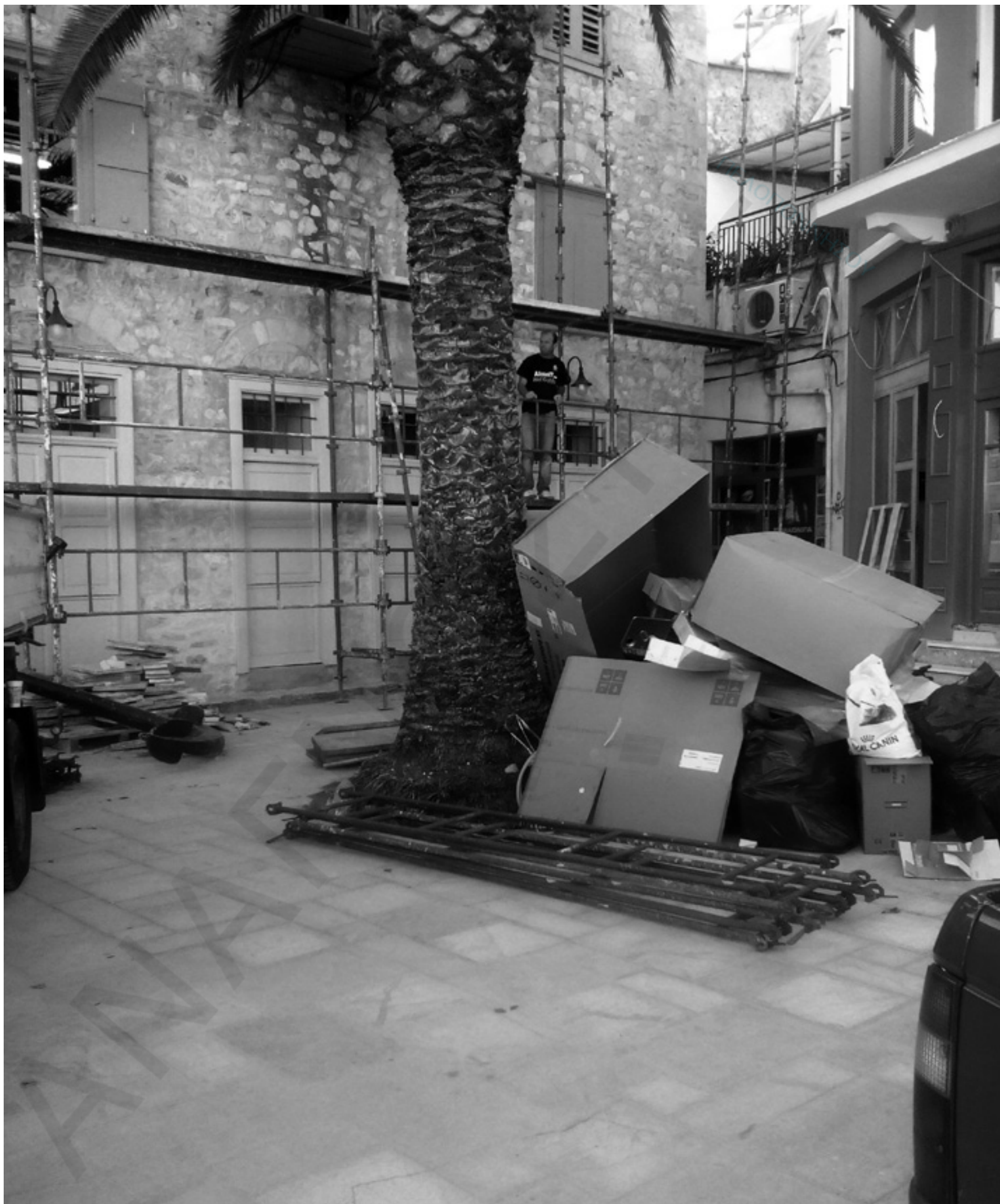
Το πρώτο μέλημα της ανάπλασης της Λ. Αμαλίας ήταν να βρεθεί κατάλληλη θέση για την προτομή του Βραχνού