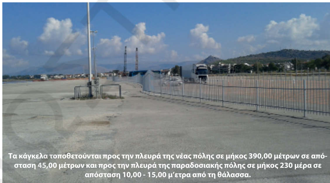
Τα κάγκελα τοποθετούνται προς την πλευρά της νέας πόλης σε μήκος 390,00 μέτρων σε απόσταση 45,00 μέτρων και προς την πλευρά της παραδοσιακής πόλης σε μήκος 230 μέτρα σε απόσταση 10,00 - 15,00 μ'ετρα από τη θάλασσα.