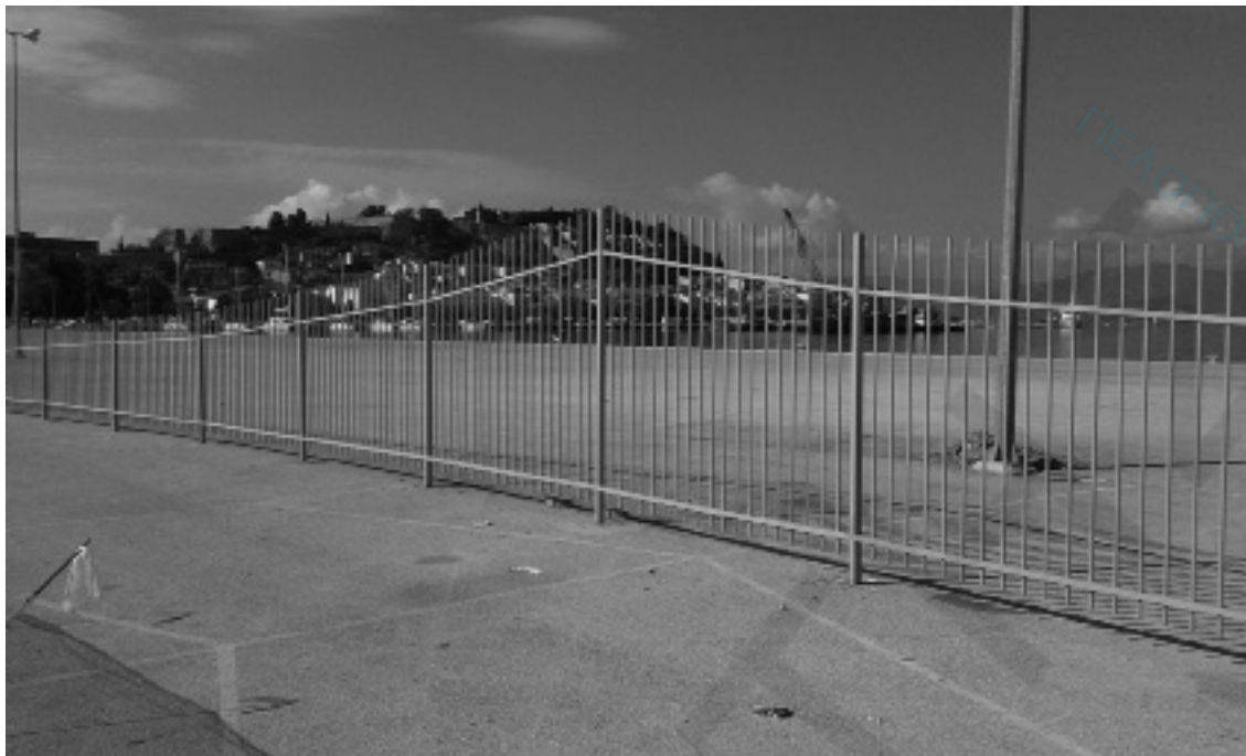
Αλλάζει η γραφική εικόνα της παλιάς πόλης του Ναυπλίου

α) Έμπροσθεν του τμήματος της παραδοσιακής πόλης συνολικού μήκους 230μ και πλάτους από το όριο του κρηπιδώματος 10,00μ.-15,00μ (Ζώνη Α) και β) Έμπροσθεν του τμήματος της νέας πόλης συνολικού μήκους 390,00μ και πλάτους από το