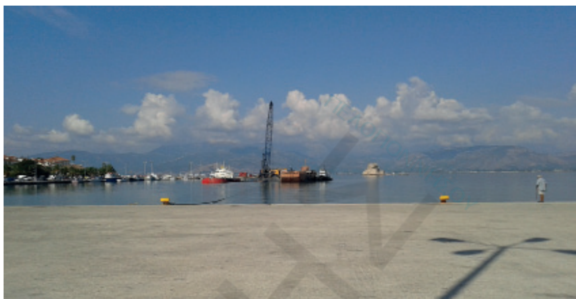
Εκκαφές διαύλου ώστε να τεθούν νέες συνθήκες ναυσιπλοΐας για την εξυπηρέτηση Κρουαζιεροπλοίων

Πολλές φορές άλλωστε έχουμε δει στο παρελθόν την αγωνιώδη προσπάθεια των λιμενικών να εξασφαλίσουν την ασφάλεια των επιβατών των κρουαζιερόπλοιων, που έδεσαν στο Ναύπλιο, με την τοποθέτηση προσωρινών κάγκελων και συνεχείς περιπολίες. Το λιμεναρχείο συχνά αποκλείει τα αυτοκίνητα σε μεγάλο τμήμα του λιμανιού της πόλης, για να αποβιβαστούν και να αποβιβαστούν οι τουρίστες των κρουαζιερόπλοιων. Το αρχικό σχέδιο, προέβλεπε να τοποθετηθεί η τεράστια περίφραξη ύψους 2,40 μέτρων με προέκταση συρματοπλέγματος, και κάμερες ασφαλείας, ώστε το λιμάνι να γίνει κλειστό. Τον Σεπτέμβριο του 2007 το Λιμενικό Ταμείο Ναυπλίου είχε αντιπροτείνει αφενός να μην κλείσει όλο το λιμάνι και αφετέρου να τροποποιηθεί το αρχικό σχέδιο της περίφραξης που ούτως ή άλλως αλλοιώνει την εικόνα της πόλης. Τον Δεκέμβριο του 2012 συντάχθηκε μελέτη για την εφαρμογή των ανωτέρω και ελήφθησαν όλες οι απαιτούμενες αδειοδοτήσεις και το έργο αυτό εντάχθηκε τον Ιούλιο του 2013 στα ΕΣΠΑ και η προέγκριση δημοπράτησης του δόθηκε τον Αύγουστο του 2013 ενώ η δημοπράτηση του έγινε τον Νοέμβριο 2013. Τέλος, γρίφος παραμένει το πώς θα επιλύσει το πρόβλημα της στάθμευσης ο δήμος Ναυπλίου, όταν κλείσει το λιμάνι. Ένα πρόβλημα που φαίνεται ότι θα φανεί, όταν κατασκευαστεί το έργο της ασφαλείας. Ήδη, αυτή τη στιγμή, ακόμα και με την μετατροπή του λιμένος σε χώρο στάθμευσης το πρόβλημα σταθμευσης είναι μεγάλο σε αργίες και τριήμερα. Πόσο μάλλον όταν θα αποκλειστεί σε μόνιμη βάση ένα μέρος του λιμανιού.