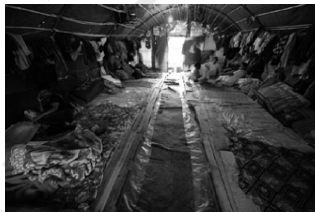
Το... παλατάκι που τους είχαν παραχωρήσει. Ας μην μιλήσουμε για χώρες θλιπνές

Και μετά μου λες εμένα γιατί υπάρχει διαφθορά στην Ελλάδα. Ε, πώς να μην υπάρχει, με τέτοιους νόμους; Που χαϊδεύουν τους εγκληματίες μας, να μην μας πάθουν τίποτα και μετά «τι θα κάνουμε χωρίς τους βαρβάρους»; Δύο μήνες κράτησε η δίκη, τουλάχιστον 45 μάρτυρες κατέθεσαν και η απόφα-