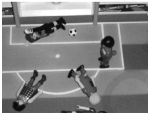
Ονειρεύτηκα τις ήττες μου...

Πήρε βιαστικός τον δρόμο για την τράπεζα, σήμερα θα έχανε την μηνιαία αναφορά του λόχου όπως έλεγε. Οι τράπεζες μια φορά το μήνα με τις πληρωμές των συντάξεων ήταν τόπος συνάντησης της γενιάς του. Αν κάποιος έλειπε σε δυο συνεχόμενες εισπράξεις τότε όλοι έβιαζαν το νου τους στο κακό. Όταν έφτασε οι φίλοι και γνωστοί είχαν φύγει, δεν βρέθηκε κάποιος να του δώσει συνωμοτικά ένα διπλό η τριπλό νόμισμα. Είναι χαρακτηριστικό φαινόμενο στις ελληνικές τράπεζες να παίρνει ο κάθε πελάτης τρία και τέσσερα νόμια από το μηχανήμα.