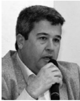
Του Τάσου Λάμπρου*

Με αφορμή το πρόβλημα της διαχείρισης και τη αποκομιδή των απορριμμάτων που αντιμετωπίζει ο Δήμος Ερμιονίδας αισθάνθηκα την ανάγκη να επικοινωνήσω μαζί σας και να ζητήσω ένα μεγάλο συγνώμη από όλους τους δημότες μας και από όλους τους παραθεριστές και τουρίστες της Ερμιονίδας για την κατάσταση που επικρατεί σχετικά με το μεγάλο ζήτημα της αποκομιδής και της διαχείρισης των απορριμμάτων μας.