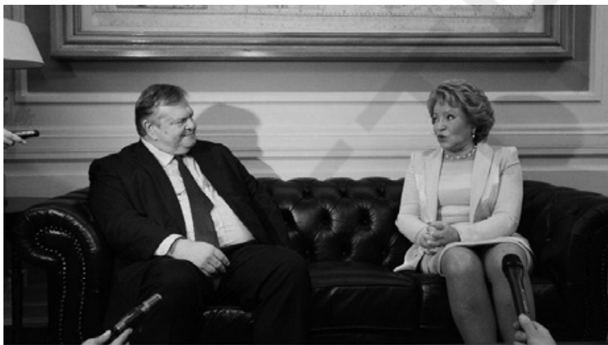
Τὸν Σεπτέμβριο τοῦ 2013 τὴν δεχτήκαμε. Τώρα ἀλλάξαμε... Ἄλλες ἐντολές!

Ἵπως καὶ γνώμη μου εἶναι ὅτι, ἂν θέλουμε ποτὲ νὰ ἀποκτήσουμε διπλωματία, θα πρέπει νὰ προσλάβουμε ἕναν Τοῦρκο, νὰ τὸν ἐλληνοποιήσουμε καὶ νὰ τὸν ἔχουμε νὰ τὸν καμαρώνουμε!) καὶ νὰ διαπιστώσει κατὰ πού πάει ἡ πίστη μας; (Γιὰ ἄλλη πίστη λέω καὶ ἀφήστε στὴν ἄκρη τὰ θρησκευτικά).