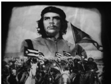
ΟΙ ΠΡΑΓΜΑΤΙΚΟΙ ΕΠΑΝΑΣΤΑΤΕΣ ΔΕΝ ΦΟΡΑΝΕ ΚΟΥΚΟΥΛΕΣ ΓΙΑ ΕΝΑΝ ΕΠΙΠΛΕΟΝ ΛΟΓΟ. ΓΙΑΤΙ ΤΟΝ ΚΑΙΡΟ ΤΗΣ ΕΠΑΝΑΣΤΑΣΗΣ Ο ΛΑΟΣ ΘΑ ΠΡΕΠΕΙ ΣΤΑ ΠΡΟΣΩΠΑ ΤΩΝ ΕΠΑΝΑΣΤΑΤΩΝ ΝΑ ΑΝΑΓΝΩΡΙΖΕΙ ΤΗΝ ΠΡΩΤΟΠΡΙΑ ΤΟΥ

Ακολουθώντας τις εντολές του διευθυντή του ο νεαρός δημοσιογράφος βγήκε στην «πιάτσα» για να καταγράψει δηλώσεις και απόψεις για το καυτό θέμα. Κάποιοι ψιθύρισαν ότι η σύλληψη έγινε σε λάθος χρονική στιγμή. Ο υπερβολικός ζήλος της αστυνομίας ίσως καταστρέψει τα μεγάλα θέματα, της τηλεοπτικής θέασης – προβολής αλλά και της οπτικής χειραγώγησης των πολιτών. Ποιος αραχτός παραλιακός μέσος, φιλήσυχος πολίτης θα διακόψει την ουζοκατάνυξη για να παρακολουθήσει με δέος το τηλεοπτικό δελτίο ειδήσεων; Κάτι το γαλάζιο της θάλασσας κάτι η δράση του αλκοόλ θα μειώσει δραματικά τον κατασταλτικό εκβιασμό των εικόνων.