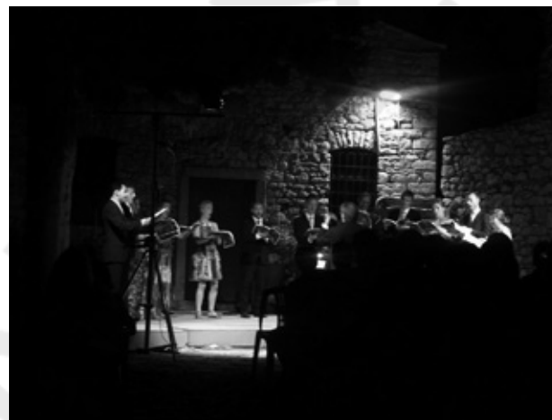
Κόσμο Παλαμῆδι 28/6/2014. (Φωτογραφία τῆς Eizen Bico). Ἡ καρδιά μὲ τὸ κοντὸ φέρεμα εἶναι αὐτὴ πού ἡ φωνὴ τῆς ὄρασης κρυσταλλοῦ! * Ἐπιναυθμοποιεῖται, γὰρὶ κἀποῦς ἔκοψε τὴν μετὴ λέξινα τὴν παρασμένη βιβλιοθήκη

Τι νὰ κάνουμε; Νὰ τελειώσουμε τὸ ἔργο καὶ γιὰ νὰ τελειώσει ἕνα ἔργο, χρειάζονται ἐργάτες, ὄχι δυὸ-τρεῖς φουκαράδες, νὰ τοὺς τρώει ὁ ἥλιος. Εκείνη