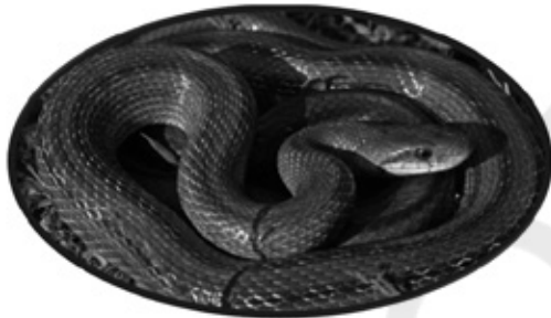
Το σαϊτάρι, η φάκα και μικρή ΔΕΗ

νο αλλά δεν τους πτοούσαν. Όμως το εμπόριο, το μεγάλο κεφάλαιο έψαχναν για νέες αγορές, ειδικά για εξαρτημένους καταναλωτές. Ο φόβος και η απειλή της πείνας είναι απαραίτητα στοιχεία για την επιβολή της αναγκαιότητας του μεταπρατικού εμπορίου, της εξαρτημένης κοινωνίας. Ένας δαιμόνιος έμπορος, μεγάλος κεφαλαιοκράτης, σκέφθηκε ότι σε βάθος χρόνου πρέπει να δημιουργήσει νέες ανάγκες στους ανθρώπους. Έπρεπε να ξεριζώσει από την καθημερινή ζωή των ανθρώπων τις τρεις βασικές έννοιες αυτάρκεια, αυτονομία και κοινότητα. Τα τρία αυτά εμπόδια έπρεπε να εξαφανιστούν για να μπορέσει να αναπτύξει τις καταναλωτικές ανάγκες. Για την κοινότητα δεν χρειάστηκε να κάνει τίποτα, έβαλε τους πολιτικούς να ακολουθήσουν μονόδρομο ευρωπαϊκό προσανατολισμό. Έτσι λοιπόν με τον «Καποδίστρια» και τον «Καλλικράτη» καταστρέψαμε τις κοινότητες, τα κύτταρα που μας κράτησαν στον Ελληνικό τρόπο στα τετρακόσια χρόνια της τουρκοκρατίας. Για την εκσυγχρονιστική Τροία ευρωπαϊκών προδιαγραφών, θυσιάζουμε σαν άλλη Ιφιγένεια των Ελλήνων την κοινότητα. Αγνοώντας συνειδητά ότι αυτή η θυσία είναι ο Δούρειος Ίππος για την τελική μας άλωση.