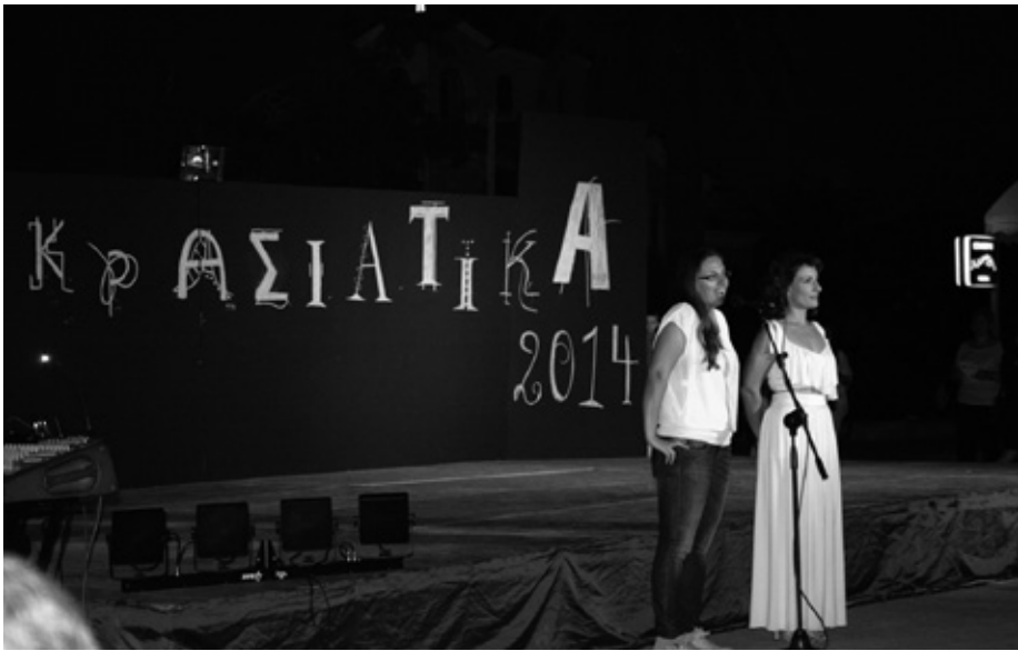
Μικρασιατικά 2014 στην Ν. Κίο