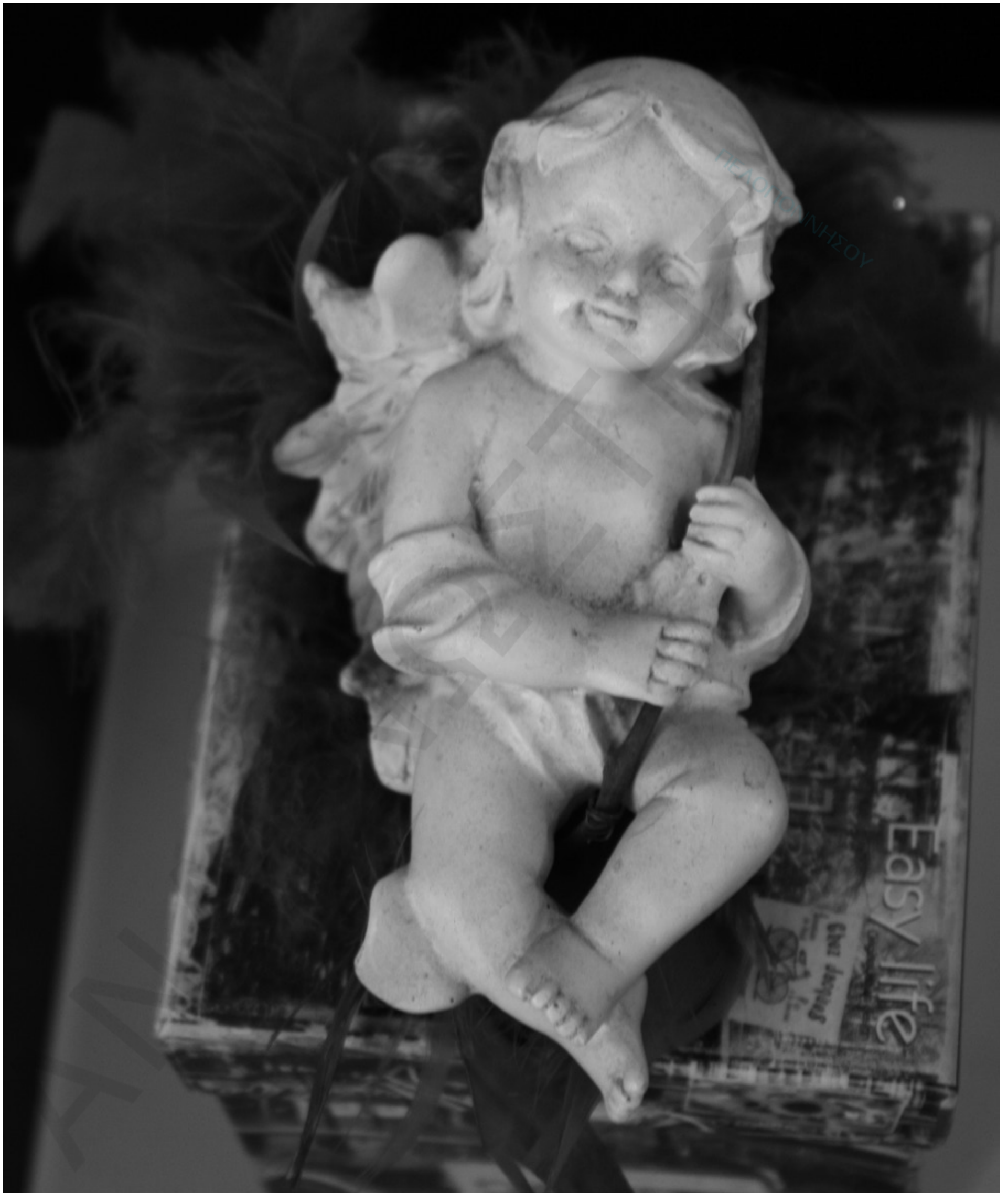
Ο έρωτας/Το αρχιπέλαγος/Κι η πλώρα των αφρών του/Κι οι γλάροι των ονείρων (Οδυσσέας Ελύτης)