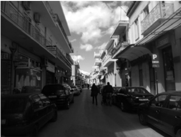
Πιάσε δύο... από την «φτερούγα»

Η πόλη σε ώρες αιχμής είναι αδιάβατη, το ποδήλατο είναι η ιδανική λύση για γρήγορη μετακίνηση. Κατεβαίνω τη οδό Τσώκρη με κατεύθυνση την πλατεία. Στην προ κρίσης εποχή, όταν λειτουργούσαν μόνο τρεις τέσσερις τράπεζες στην πόλη, αυτή η μικρή οδός συντηρούσε το λιγότερο πενήντα καταστήματα. Και τα συντηρούσε με επιτυχία γιατί μιλάμε για ένα χρονικό διάστημα από αρχές της δεκαετίας του πενήντα μέχρι την δεκαετία του ογδόντα. Στην τελευταία δεκαετία, του ογδόντα άρχισαν οι μεγάλες αλλαγές, ο εργάτης έγινε χρεωμένος μικροαστός βάζοντας ενέχυρο