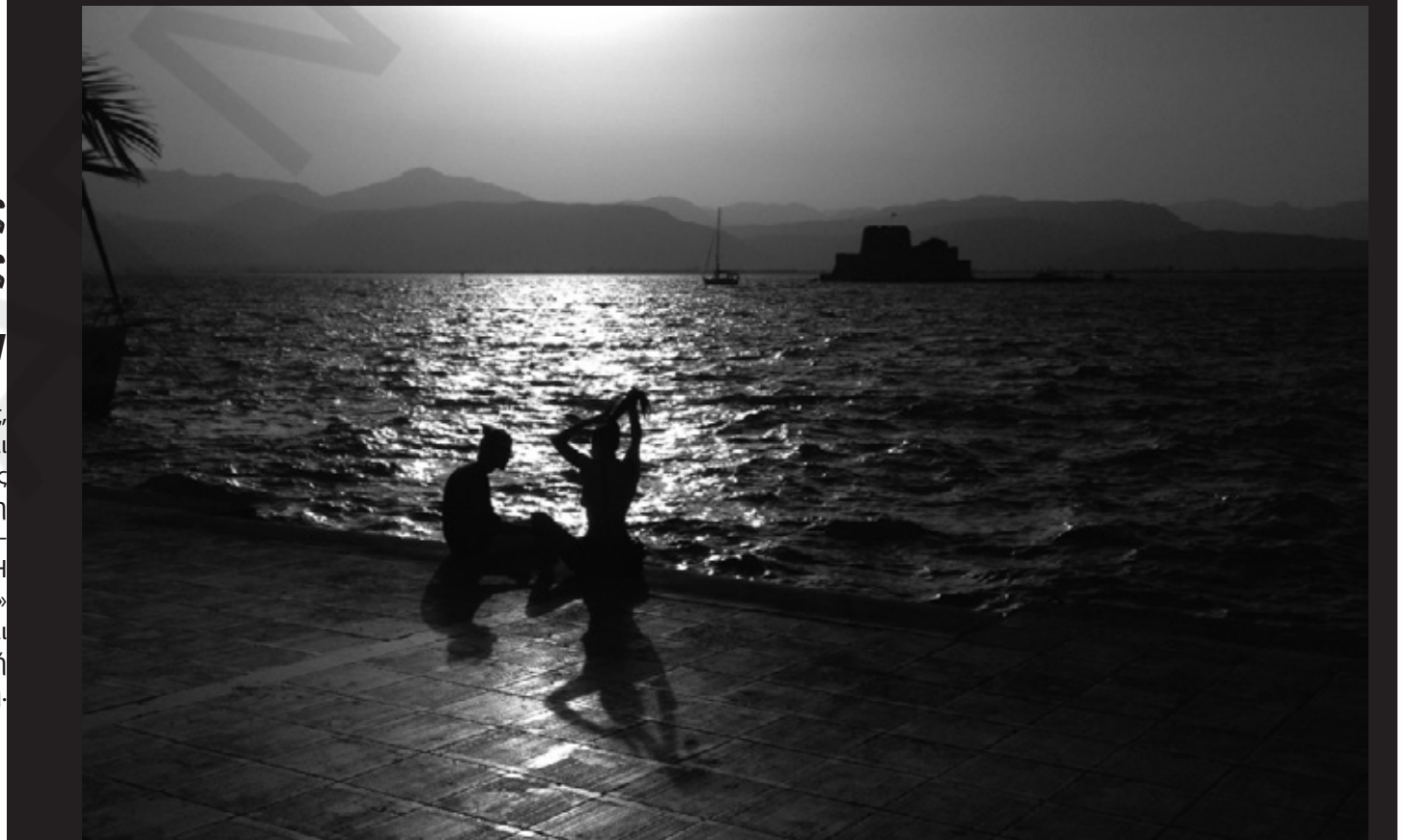
Παιχνίδια του Πουνέντη με τον Ήλιο το απομειήμερο Θαν. Τόμπρας

Στείλτε τις φωτογραφίες σας για να δημοσιευτούν