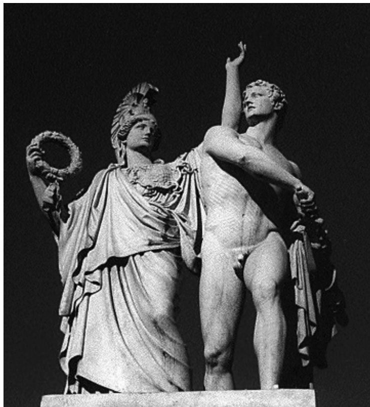
Άγαλμα της Αθηνάς που συμβουλεύει τον Διομήδη λίγο πριν μπει στη μάχη - (Γέφυρα Schlossbrücke, Βερολίνο)