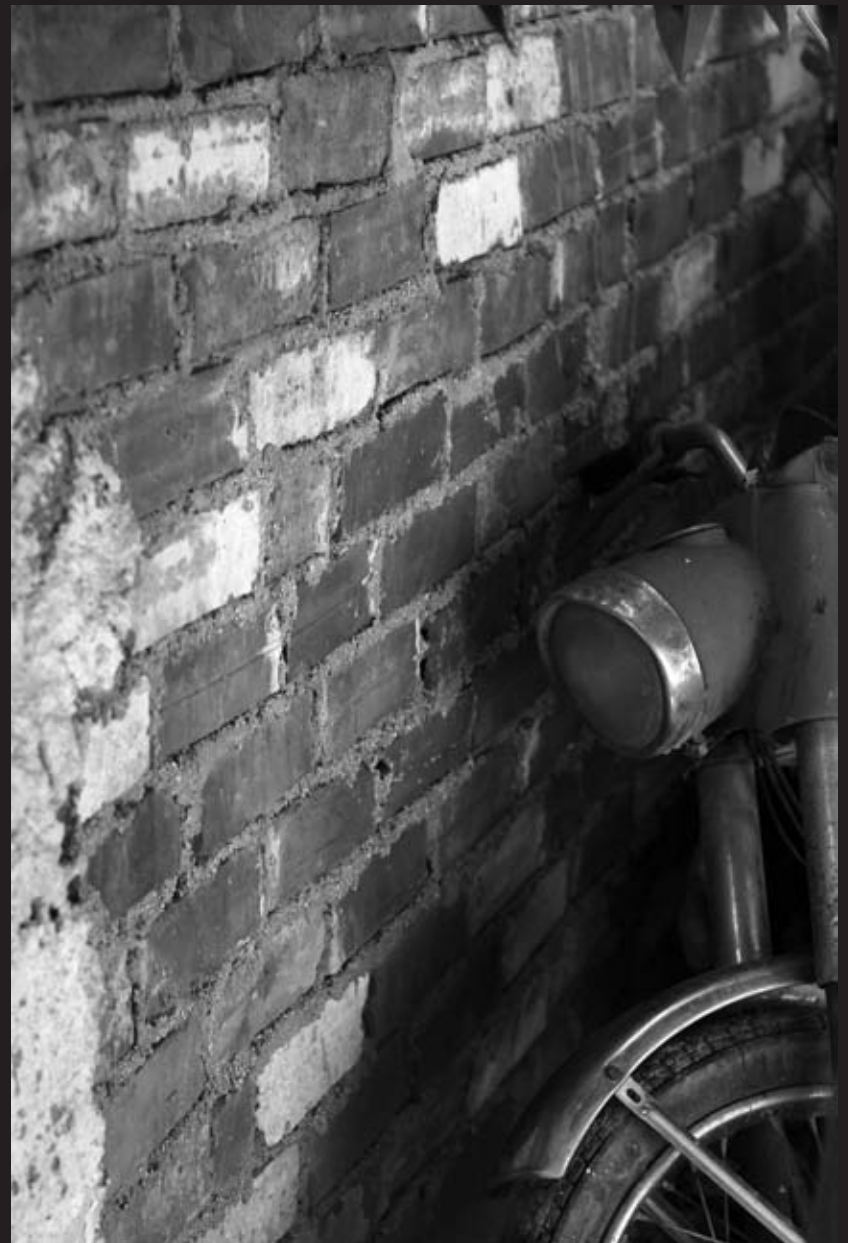
Περασμένα μεγαλεία... Νίκος Αντωνόπουλος