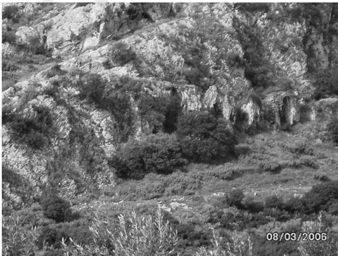
Καμάρες Αδριάνειου Υδραγωγείου Κορίνθου κοντά στο Γυμνό Αργολίδας.

Τροφοδοτούσε την Αρχαία Κόρινθο με νερό από τη λίμνη Στυμφαλία. Τα σπουδαιότερα υπολείμματα του σπουδαίου αυτού έργου στην πλευρά της Αργολίδας υπάρχουν στις περιοχές Γυμνού (φωτο) και Μαλανδρενίου στη θέση Ρουσαλία.