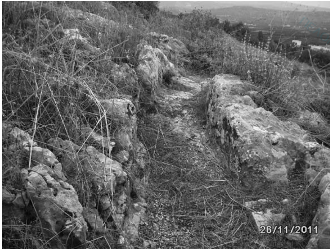
Επίγειο τμήμα αγωγού στα Σταθείκα Άργους, τμήμα του οποίου είναι λαξευμένο στον ασβεστόλιθο.

Ο αυτοκράτορας Αδριανός ξεκίνησε από την πηγή αυτή την κατασκευή υδραγωγείου για την ύδρευση του Άργους. Ο αγωγός ήταν ανοιχτός επιφανειακός ορθογώνιας διατομής που οι εσωτερικές του πλευρές ήταν επιχρισμένες με αμμοκονίμα για να είναι στεγανοί και η βάση ήταν στρωμένη με πλάκες. Στα σημεία της διαδρομής που υπήρχε ασβεστόλιθος ο αγωγός έχει λαξευτεί στο βράχο (φωτ. Σταθείκα), ενώ στους χειμάρρους είχαν κατασκευαστεί υδατογέφυρες (κοίτες Ινάχου και Χάραδρου). Ο αγωγός ακολουθούσε τη διαδρομή Κεφαλόβρυσο – Δούκα Βρύση- Τσιρίστρα, όπου εμπλουτιζόταν με τα νερά και άλλων πηγών –στη συνέχεια Στέρνα-Σχινοχώρι- Σταθείκα- Άκοβα –Άργος, όπου κατέληγε σε δύο δεξαμενές σκαλισμένες