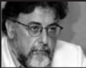
Του Γιάννη Πανούση, καθηγητή Εγκληματολογίας στο Πανεπιστήμιο Αθηνών

Αρκούν οι καταγγελίες, κατηγορίες ή και καταδίκες για διεύθυνση/συμμετοχή σε Εγκληματική Οργάνωση για να ξεριζωθεί η Χρυσή Αυγή (ΧΑ) από την κοινωνία;