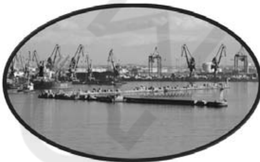
ΤΑ ΛΙΜΑΝΙΑ ΤΟΥΣ ΓΕΜΑΤΑ ΜΕ ΚΙΝΕΖΙΚΗ ΑΡΜΑΤΑ...

-Λοιπόν για να είναι χρηστικό το λιμάνι του Πειραιά πρέπει να έχει ένα κάθετο άξονα διόδου προς την Κεντρική Ευρώπη. Μόνο έτσι έχει αξία η είσοδος εμπορευμάτων στην Ελλάδα. Ο κάθετος άξονας είναι η πρώην Γιουγκοσλαβία, η οποία λόγω σοσιαλιστικής κληρονομιάς, την δεκαετία του 90 διαθέτει ένα άρτιο σιδηροδρομικό δίκτυο. Οι Γιουγκοσλάβοι διατηρούν καλές σχέσεις με την Ελλάδα, η πιθανότητα να δημιουργηθεί ένα τέτοιος χρυσοφόρος εμπορευματικός