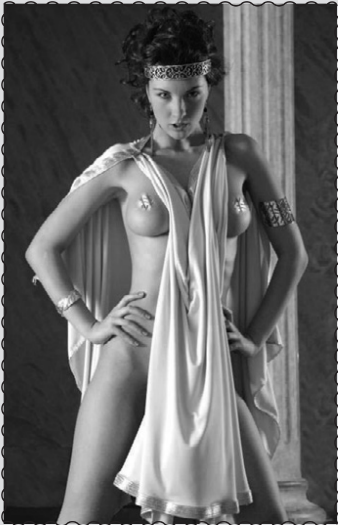
Με ένα σεντόνι και με μονωτική ταινία φτιάχνεις μια θαυμάσια αποκριάτικη στολή