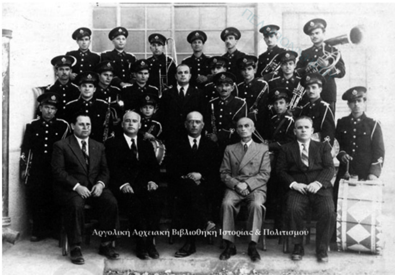
Αρχαία Αρχαία Βιβλιοθήκη Ιστορίας & Πολιτισμού