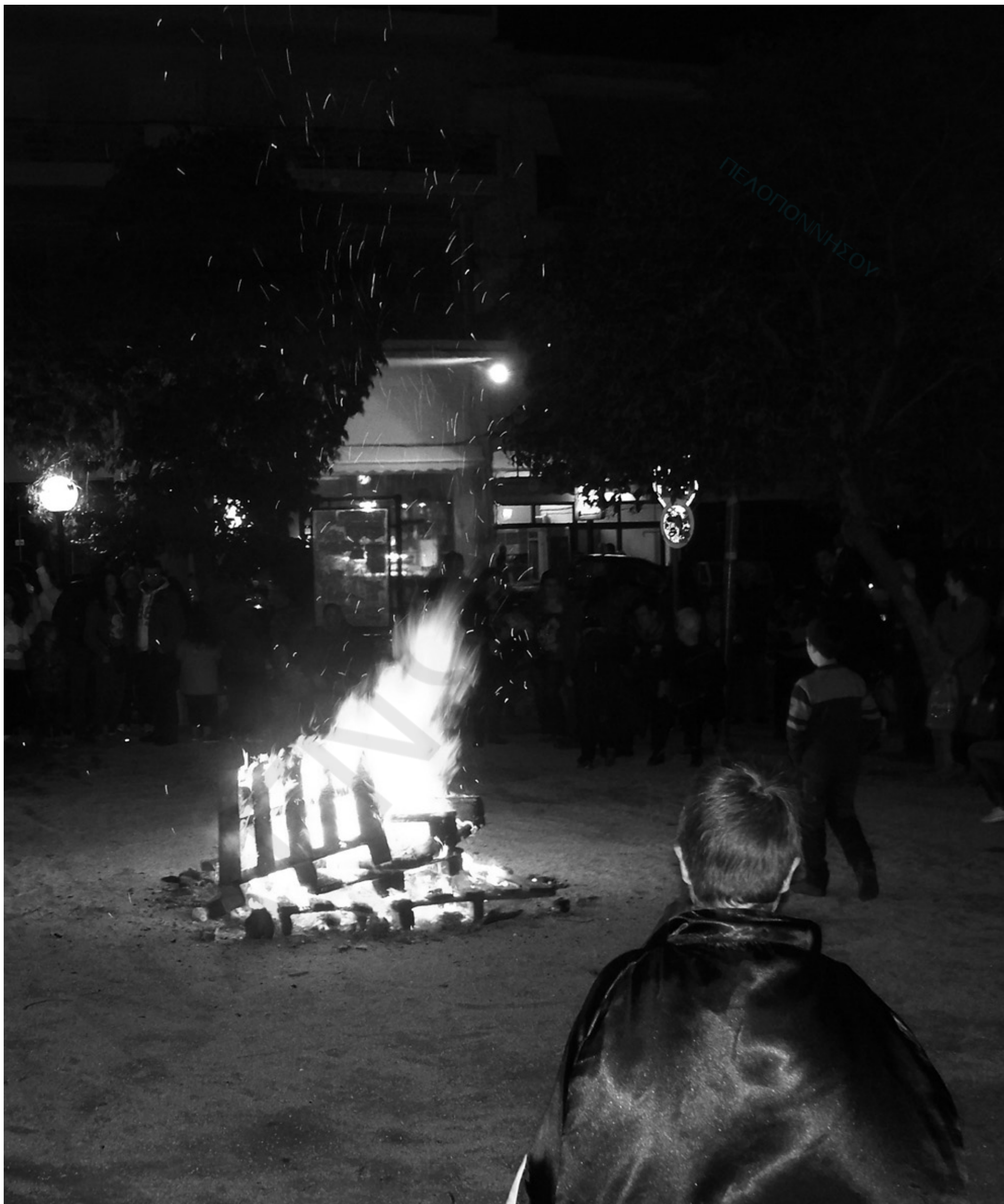
Το τριώδιο μόλις άνοιξε και θα κλείσει με τις εκλογές για την αυτοδιοίκηση