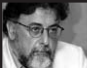
Του Γιάννη Πανούση, καθηγητή Εγκληματολογίας στο Πανεπιστήμιο Αθηνών

Ίσως έτσι θα ανατείλει και πάλι ο ήλιος της Δημοκρατίας και θα δύσει η μαύρη αυγή του μίσους.