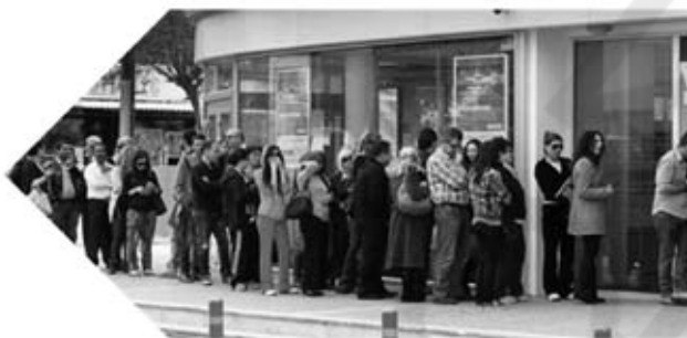
ΟΙ ΦΥΛΕΣ ΤΗΣ «ΟΥΡΑΣ»

-Ακρίβυνη και το πετρέλαιο και το καφενείο, κάθεται στην τράπεζα ζεσταίνεται, πίνει το καφεδάκι που έχει στο ένα μπουκαλάκι, το νεράκι του από το άλλο και ξεκοκαλίζει την κυριακάτικη εφημερίδα του. Άντε καλή χρονιά να έχουμε και καλή τύχη μάγκες και χαλαρά (είπε ο Μητσάρας και ο καθένας πήρε το δρόμο του).