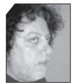
του Άκη Ντάνου

Ήρθαν τα Χριστούγεννα που τόσα παιδάκια περιμένουν. Άλλα ξενυχτούν περιμένοντας να δουν τον Άγιο Βασίλη ν' αφήνει το δώρο τους κάτω απ το φρεσκοκομμένο έλατο, άλλα περιμένοντας το έλκθηρο να τα πάρει μακριά απ τον βάρβαρο τούτο κόσμο. Άλλοι γυρνούν στα καταστήματα ψάχνοντας το ιδανικό κοστούμι για το ρεβεγιόν και άλλοι γυρνούν στους δρόμους ψάχνοντας ένα ανθεκτικό χαρτόκουτο για να τυλίξουν το κορμί τους. Είναι μέρες αγάπης ... είναι η εβδομάδα της αγάπης, κάποιους μήνες πριν την εβδομάδα των παθών. Η πολιτεία θα φροντίσει να περισυλλέξει τους άστεγους ώστε να μην στέκονται εμπόδιο στο διάβα των καταναλωτών, και οι εκπρόσωποι των κομμάτων θα επισκεφτούν γηροκομεία δείχνοντας το ενδιαφέρον τους για τα "περήφανα γηρατεία".