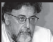
Του Γιάννη Πανούση, καθηγητή Εγκληματολογίας στο Πανεπιστήμιο Αθηνών

Μέσα στην κρίση, ανάμεσα στα άλλα, χάσαμε και την αυτο-εικόνα και την αυτο-γνωσία μας.