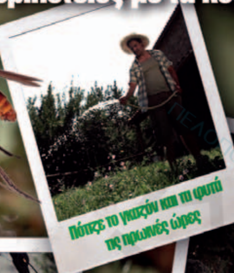
Πότισε το γραζόν και τη φυτιά τις πρωινές ώρες