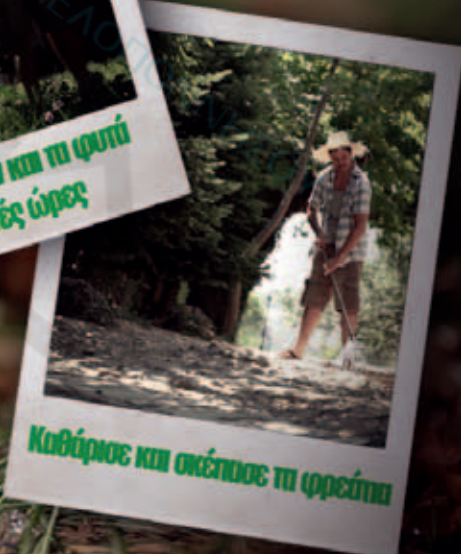
Καθάρισε και σκέπασε τη φρεσάπια