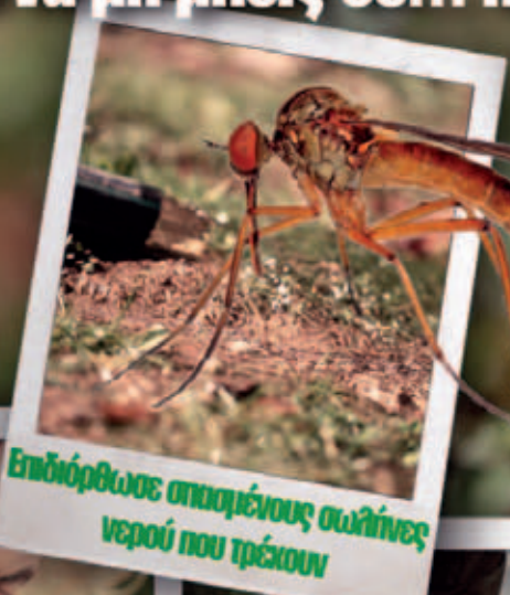
Επιδιόρθωσε σπασμένους σωλήνες νερού που τρέκουν