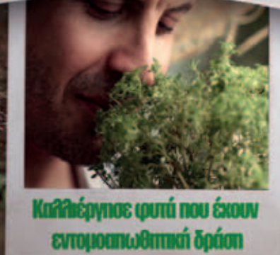
Καθαίρεγισε φυτά που έχουν εντομοαπωθητική δράση