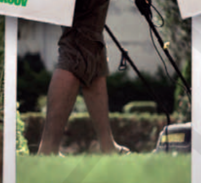
Κούρεψε το γρασίδι και τους θάμνους