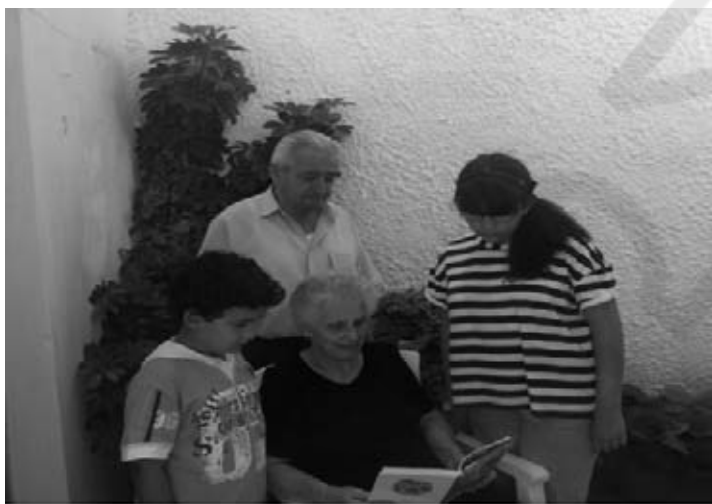
Την φτώχεια και τον φασισμό μόνο με τα γράμματα τον νικάς

-Μα τόσο φτωχό μυαλό είχαν παιδάκι μου, αντί να κάτσουμε να το πιούμε μαζί αδελφωμένοι, πότιζαν το χώμα μίσος αδελφοκτόνο. Χύθηκε το κρασί δεν πειράζει αλλά με πονάει ακόμα γιατί χύθηκε πολύ αίμα αδελφικό ..... να μην δουν τέτοια τα μάτια σας.