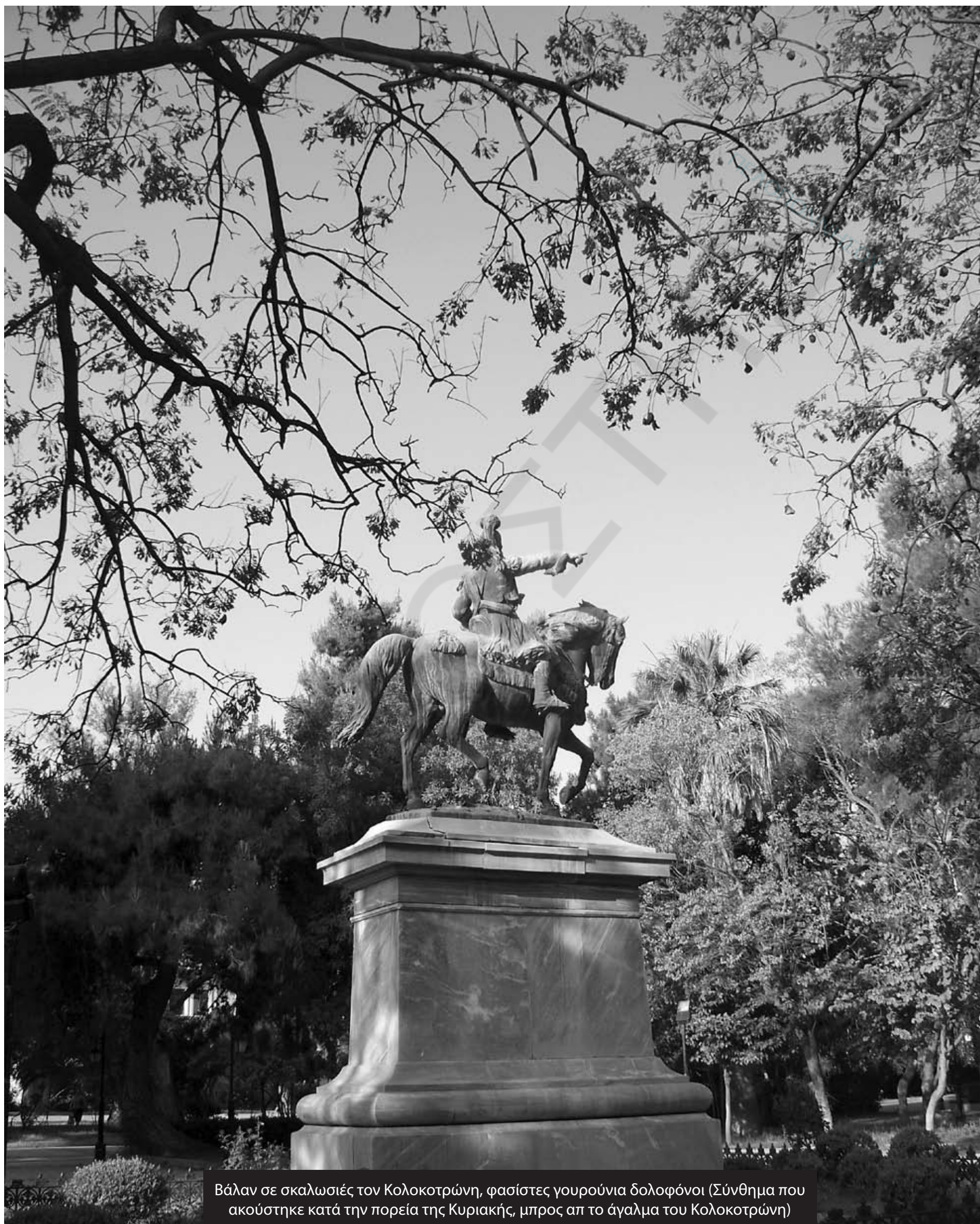
Βάλαν σε σκαλωσιές τον Κολοκοτρώνη, φασίστες γουρούνια δολοφόνοι (Σύνθημα που ακούστηκε κατά την πορεία της Κυριακής, μπρος απ το άγαλμα του Κολοκοτρώνη)