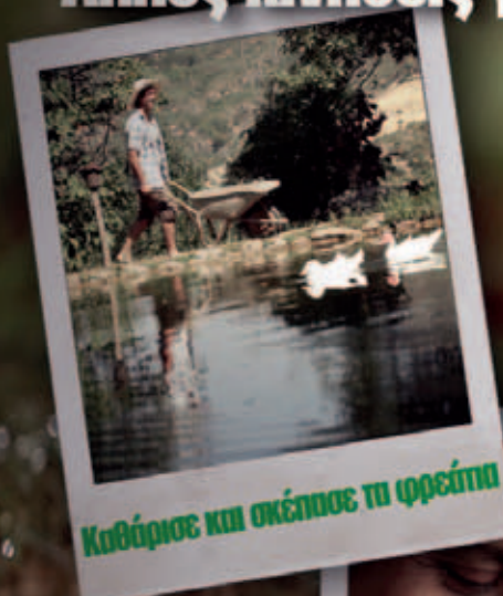
Καθάρισε και σκέπασε τη φρεσάπια