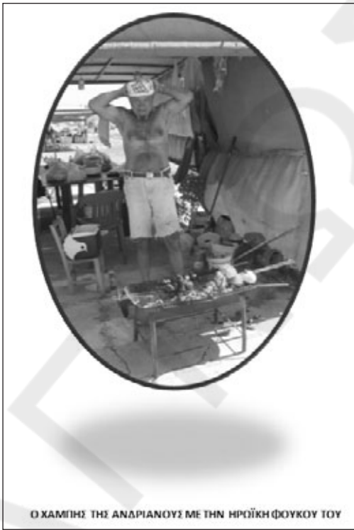
Ο ΧΑΜΠΙΣ ΤΗΣ ΑΝΔΡΙΑΝΟΥΣ ΜΕ ΤΗΝ ΗΡΩΙΚΗ ΦΟΥΚΟΥ ΤΟΥ

Τελειώνουν οι δυο εβδομάδες και οι δυο κράτησαν τον λόγο τους, ο Χαμπίς δεν πήγε τα Σάββατα και το αφεντικό τον απόλυσε,