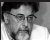
Του Γιάννη Πανούση, καθηγητή Εγκληματολογίας στο Πανεπιστήμιο Αθηνών

στά υποκρισία (αν δεν υποκρύπτει άλλους στόχους).