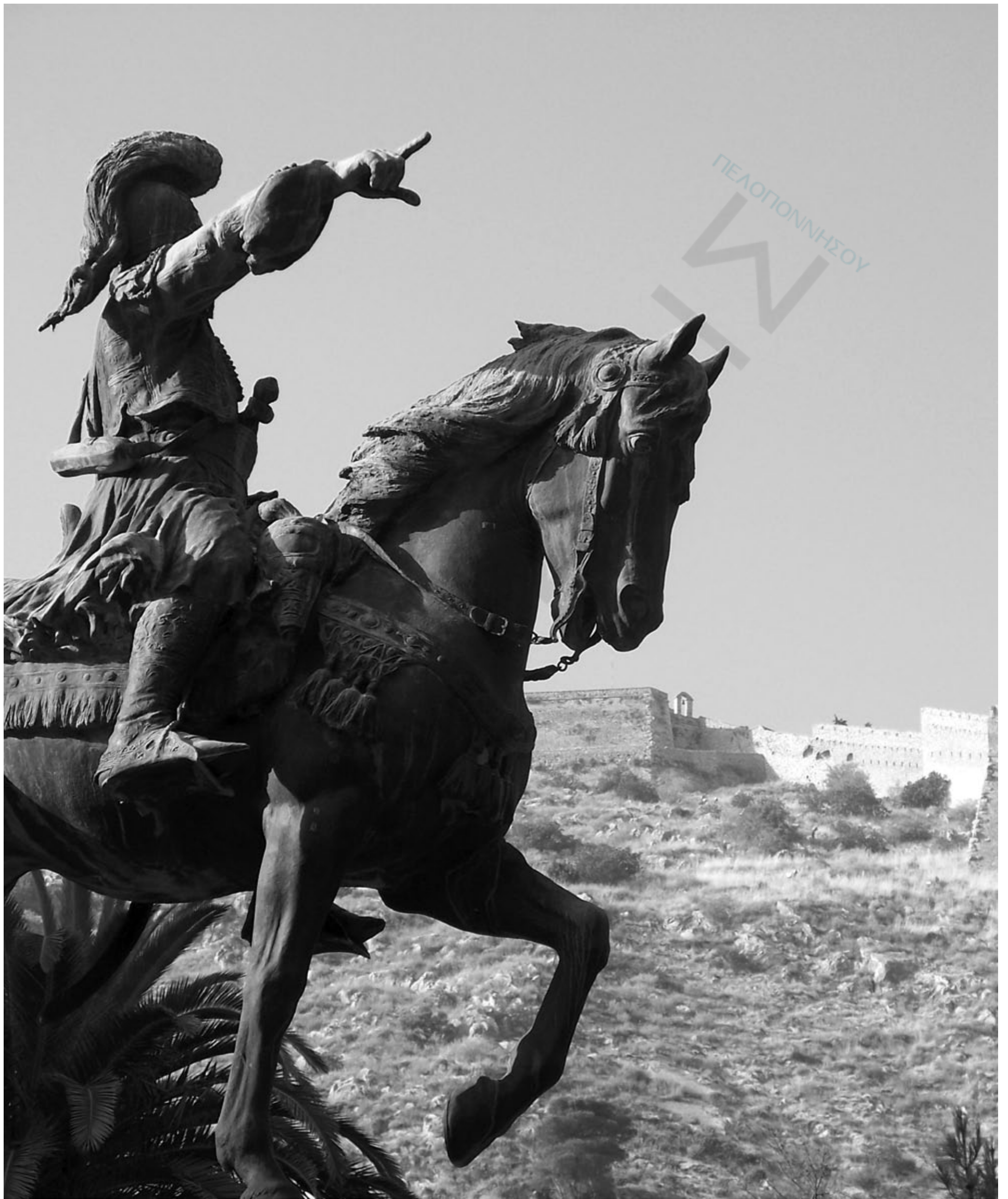
Τελικά προς τα Μομπέικα στην χωματερή του Άργους δείχνει ο Κολοκοτρώνης